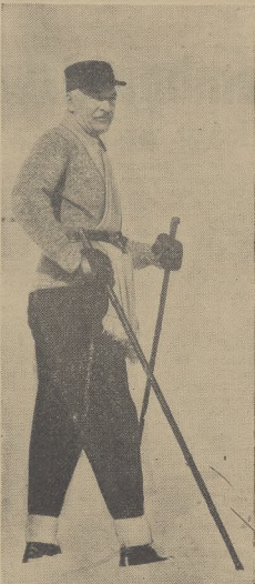
Pan Prezydent Rzeczypospolitej Prof. Dr. Ignacy Mościcki podczas wycieczki narciarskiej.

ŻYCIE MIAST I WSI WOJEWÓDZTW POŁUDNIOWO - WSCHODNICH