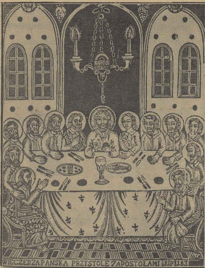
Reprodukcja „Ostatniej Wieczery” z książki Władysława Skoczylasa pt. „Drzeworyt Ludowy w Polsce”.