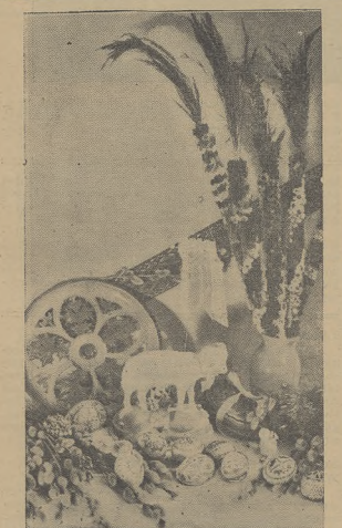
Tradycyjny baranek na stole wielkanocnym.

Towarzystwo Szkoły Ludowej, chcąc umożliwić zdolną a niezamożną młodzież wjejskiej kształcenie się w szkołach średnich ogólnokształcących i zawodowych, powołało do życia i utrzymuje obecnie na terenie Małopolski 14 burs, z których jedna są przeznaczona dla chłopców, drugie dla dziewcząt. Bursy te znajdują się w następujących miastach: w Berezowie, Buczaczu, Czortkowie, Gródku Jagiellońskim,