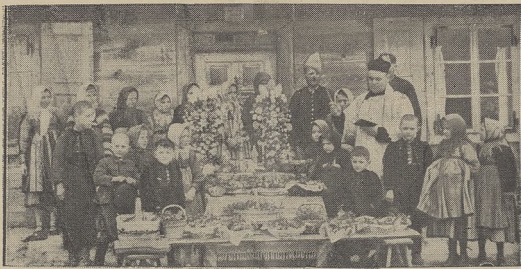
Fragment święcenia darów Bożych w Wielką Sobotę Wielkanocną w wiejskiej chacie.

O wielkości narodu decyduje przede wszystkim siła, z jaką gotów jest bronić swej godności narodowej. Tę silę zapewnić naszej Armii jest w tym momencie bezwzględny obowiązek, to też przed narodem — zdawna już gotowym — stanęło do spełnienia doniosłe, pilne i niecierpiące zwłoki zadanie dobrojenia Polski w powietrzu, uczynienia z naszego Państwa potęgi lotniczej. Dziś, gdy jasno zdajemy sobie sprawę z tej prawdy, że tylko silny, potężnie u-