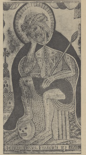
Chrystus Frasobliwy — reprodukcja z książki Władysława Skoczylasa pt. „Drzeworyt Ludowy w Polsce”.

W tej uroczystej chwili, gdy rozdzwoniły się wielkanocne dzwony i tradycyjnym zwyczajem padną serdeczne i miłości owiane życzenia wśród rodzin i w zespołach organizacyjnych — śpieszymy i my, by złożyc jaknajserdeczniejsze życzenia „Wesołych Świąt” wszystkim Czytelnikom, Przyjaciółom Współpracownikom „WSCHOD-u”, którzy zespólnili się około warsztatu naszej pracy publicystycznej i obywatelskiej.