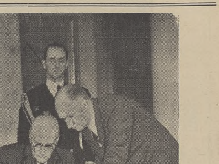
Pan Prezydent Rzeczypospolitej prof. dr Ignacy Mosicki podpisuje deklarację Pożytecznej Przeciwności

je utajami. Wiedza i wola ludzka śmiało sięgnęły po