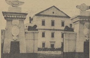
Zamek Tarnowski w Tarnopolu od strony zachodniej, odnowiony ostatnio przez władze wojskowe. Na przedzie dwa pylony, zbudowane zamiast dawnej bramy w początku XIX wieku.