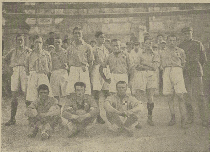
Drużyna 6-ej Eskadry lotniczej garnizonu łódzkiego.

W. K. S. „Kresy“ z Brześcia nad Bugiem uprasza wszystkie Kluby Sportowe, życzące sobie rozegrać zawody, o nadesłanie warunków i terminów pod adresem: Ppr. Więcek, D. O. G. w Brześciu. J. Wł. K.