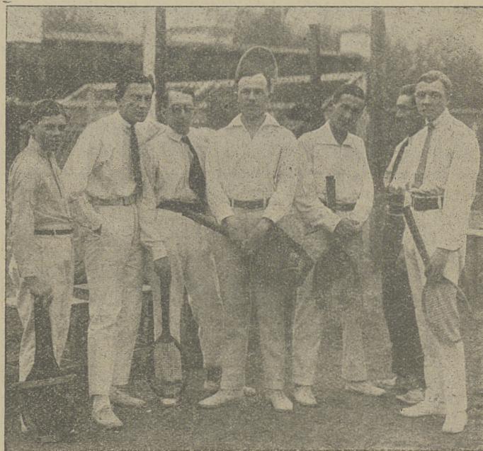
Grupa uczestników turnieju tenisowego o mistrzostwo Okręgu Lubelskiego.