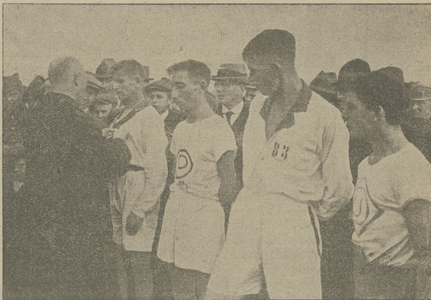
Wręczenie nagród zwycięzcom w biegu na przełaj, który się odbył w Poznaniu dnia 6 listopada.

Mistrzostwo I. klasy: Ostmark—Rapid 5:3 (4:1)! Najmłodszy klub pierwszoklasowy bije mistrza Austrii! Hakoah—W. A. F. 5:3, Hertha—Wien 2:0,