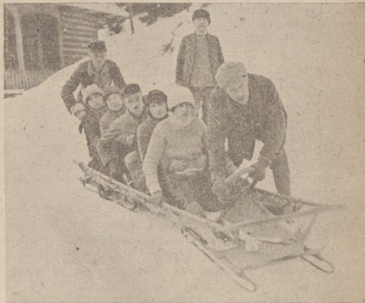
Tor bobsleighowy w Zakopanem (Kuznice).