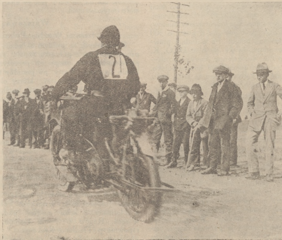
Wyścigi cyklistów i motorzystów w Poznaniu. — Kuszczynski, drugi na motorze.

Jak w ostatniej chwili się dowiadujemy, do szeregu zwycięstw, odniesionych przez Fiata w bieżącym roku,