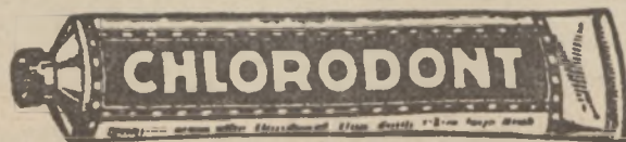
PASTA DO ZĘBÓW.

Anglja. Mistrzostwo I. ligi: W. Arsenal—Cardiff City 2:1, Aston Villa—W. Bromw. Albion 1:0, Birmingham—Manchester City 5:1, Everton—Blackburn Rovers 1:0, Sunderland—Bolton Wanderers 1:0, Burnley—Tottenham 5:2, Middlesborough—Chelsea 2:1, Huddersfield—Stoke 1:0, Liverpool—Preston N. E. 2:0, Newcastle Unit.—Sheffield Unitet 5:1, Notts Forest—Oldham Athl. 3:0. Prowadzą Newcastle przed Burnley'em i Chelsea.