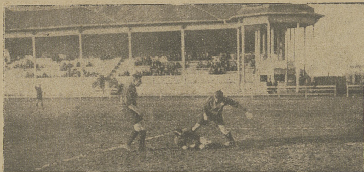
Z zawodów Wisła—Polonia (Przemyśl) w Krakowie: Bramkarz gości znowu wypoczywa...

W gościach poznaliśmy drużynę, która wprawdzie nie nowego a nawet szczególnie pięknego nie pokazała, ale która jednak umie grać celowo i z poświęceniem. Piłkę jaknajdalej utrzymać od swojej bramki, a pod bramką przeciwnika szybko działać — oto dewizy Polonii. Tu i ówdzie widać pewną chęć kombinowania, ale brak temu cechy jednolitości i myśli przewodniej. Nie chcę jednak być zbyt srogim o sędzie i uważam, że może początek sezonu jest winą tych braków. — Wisła wykazała dobre przygotowanie ale spodziewaliśmy się czegoś więcej. Uderzyła szczególnie