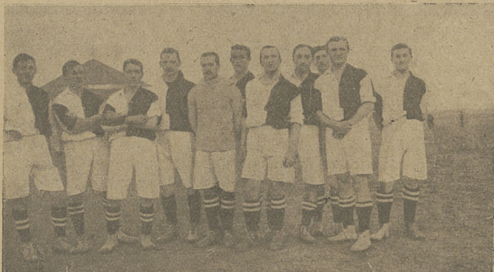
Drużyna AZS-u w roku 1912 Kraków.

W dniach 18 i 19 bm. odbył się w Warszawie Zjazd konstytuujący Centrali Polskich Ak. Zw. Sport. Zjazd ten nie był niczem niespodziewanem dla polskiego sportowego świata akademickiego. Po odbytej w grudniu u. r. w Kra-