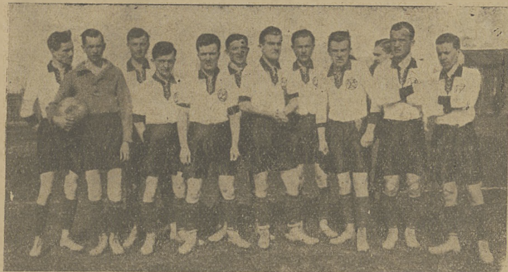
Drużyna A. Z. S-u w roku 1922 w Krakowie.