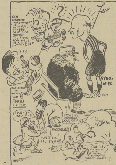
Popularne postacie prezesa dr. Cetnarowskiego i kapitana Cracovii w udatnej karykaturze dziennika „Aarhus Stiftstidende“.

Den tabte dog deres første Kamp til A. G. F. — Aarhus mod Skovby Andersen til Gjengæld i Gaar.