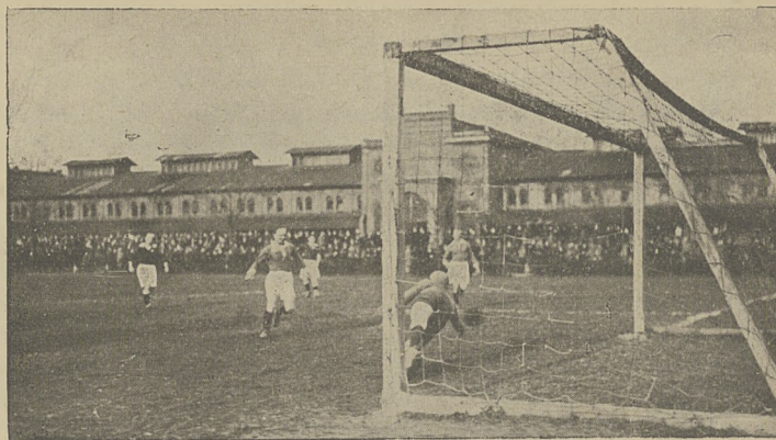
Moment z zawodów Polonia—Legia 2:0 w Warszawie.

Zarząd Soły składa tą drogą jednemu z najbardziej zasłużonych dla T-wa członków, wyrazi szczerego współczucia.