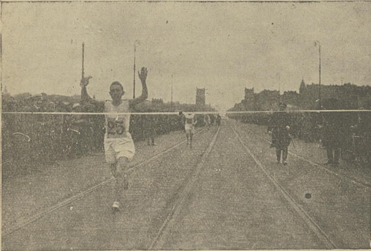
Z biegu okrężnego „Kurjera Polskiego” w Warszawie.

W niedzielę dnia 8 kwietnia po raz pierwszy w Polsce miałem możliwość obserwowania biegu lekkoatletycznego w zawodach zorganizowanych przez „Kurjer Polski” w Warszawie. Ogólnie biorąc, wyniki tego biegu wskazują na to, że