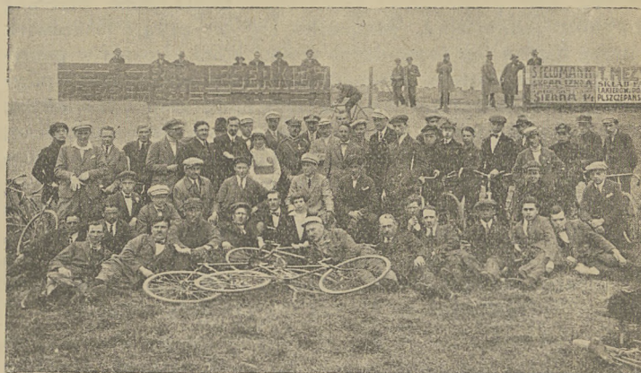
Wycieczka Sekcji kolarskiej K. S. Cracovia.