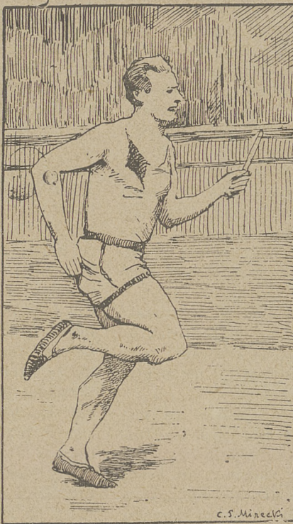
Paddock w pełnym sprincie. Charakterystyczna praca rąk (ręka niewychodzi poza udo).

jest koniecznością nieuniknioną — powoduje on bowiem gwałtowne wydzielanie się substancji toksycznych (trujących) nagromadzonych w organizmie. Ponieważ sposób masowania wymaga fachowej wiedzy i jest czynnością bardzo męczącą — powinien każdy klub lekkoatletyczny przewidzieć