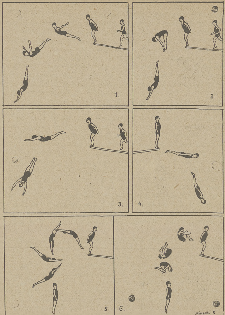
Tablica skoków obowiązkowych, objętych programem mistrzostw Polski:

Drugie z rzędu mistrzostwa Polski w pływaniu odbędą się w roku bieżącym w dniu 2 września — tym razem w Krakowie. Zeszłoroczne zawody odbyły się, jak wiadomo, w Warszawie. Polski Związek Pływacki, który dysponuje w całym kraju jednym jedynym regularnym basenem pływackim w Parku Krakowskim w Krakowie, polecił też urządzić zawody te Sekcji Pływackiej AZS. Kraków. Decyzja ta była bardzo trafną. Basen krakowski bowiem i jego urządzenia dodatkowe w zupełności nadają się dla przeprowadzenia tak poważnych zawodów, jakimi są niewątpliwie mistrzostwa państwowe. Mierzy on dokładnie 50 y. długości i 25 y. szerokości. Miejsce dla startu z brzegów basenu znajduje się 60 cm. nad powierzchnią wody, co z jednej strony zgadza się z wymogami regulaminu, z drugiej przyczyni się do poprawy czasów w sprintach. Poszczególne wyścigi odbędą się w dystansach yardowych, co zupełnie