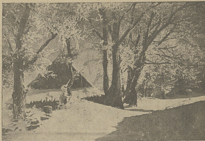
Leśniczówka na Magórcze (Bielsko).

Bieg senjorów (trasa około 9 km. długości): 1) Erhardt Walter, 24' 19"; 2) Jenkner Hans, 24' 19 4"; 3) Aschenbrenner Fr., 25' 2";