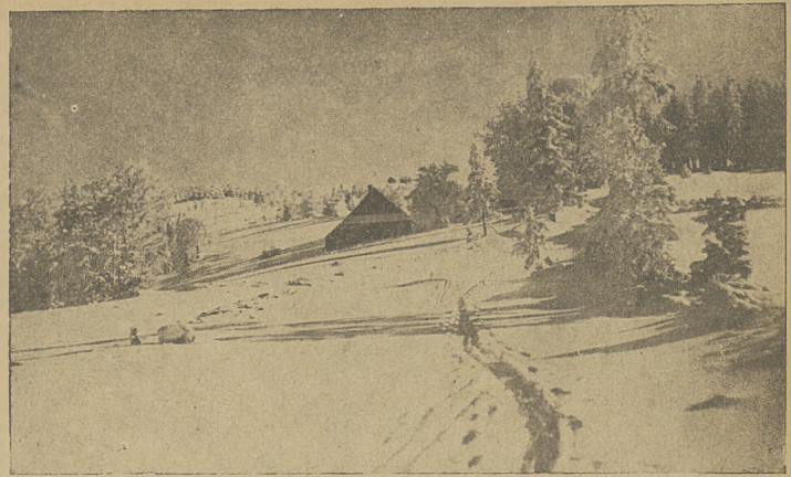
Droga na szczyt Magórki (Bielsko).

Ciszę wakacyj piłkarskich, które sezon zimowy oddzielają od wiosennego, przerwały finały o tytuł mistrza kl. C okręgu Łódzkiego. Kroniki piłkarskie Łodzi zapewne po raz pierwszy notują fakt użycia tak późnego terminu, co zresztą w naszych warunkach jest wprost złamaniem tradycji, te zaś nie każą szanującym się zespołom rozgrywać zawodów tak późną jesienią. Trzeba jednak wejść w trudne położenie ŁZOPN-u (sic.), który niestety nie może nigdy zna-