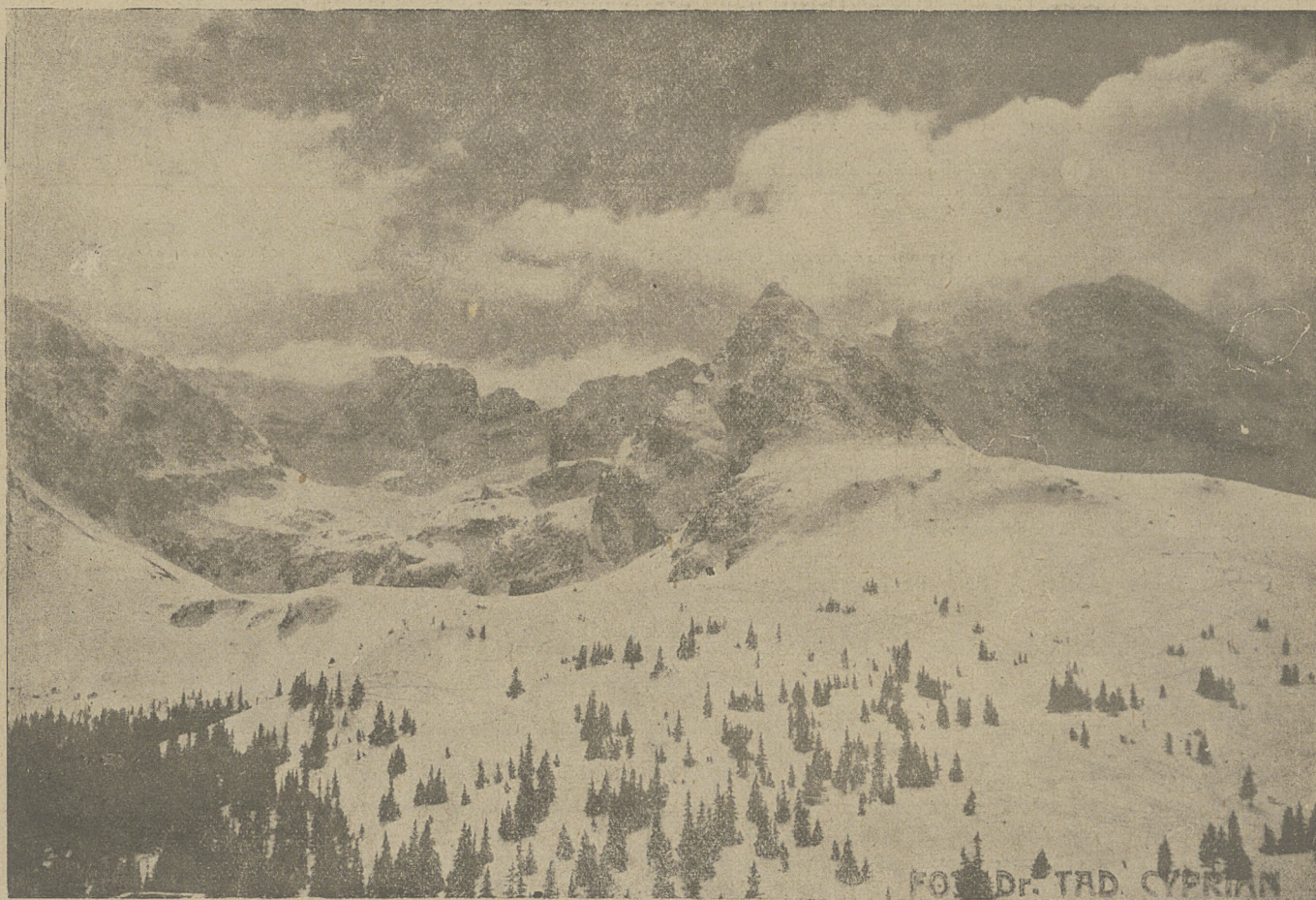
Widok Hali Gąsienicowej w zimie.