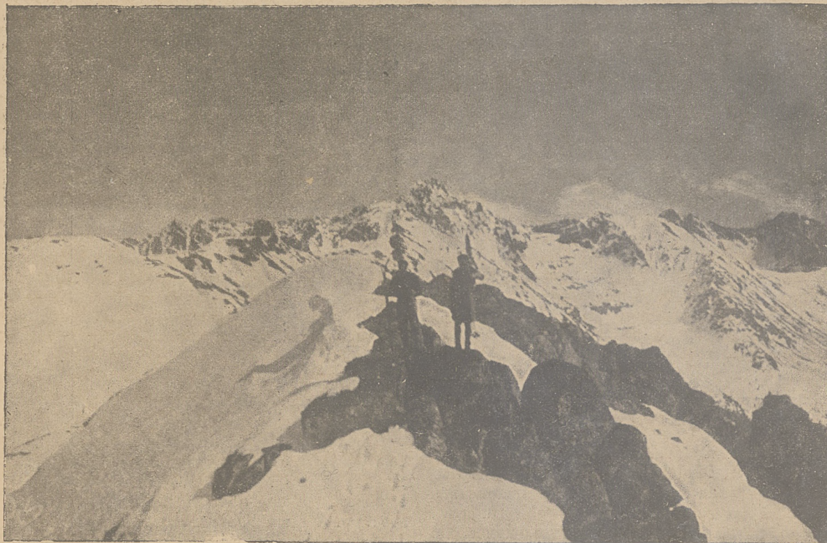
Z wypraw narciarskich Krakowskiego AZS-u. Trawers Czerwonych Wierchów.

Wszystkie te ćwiczenia przegradzać można odpowiednimi ćwiczeniami gimnastycznymi na nartach, ciągle jednak mając na uwadze celowość narciarską. A więc przy postawie zasadniczej ćwiczyć należy głęboki przysiad, wraz z tak zwanym „huśtaniem“, czyli „sprężynowaniem“ kolan, odstawianie jednej narty do pozycji oporowej, to samo ćwiczenie skokiem i t. d. Ponieważ przy pozycji oporowej niezmiernie ważnym jest odciążenie nogi oporującej, należy ćwiczyć stanie na nartie prowadzącej i podnoszenie w powietrze narty oporującej. Pozycję płużącą ćwiczyć należy skokiem, przyczem ciągle należy mieć na oku zasadę stylu, która nigdzie zaignać nie powinna, a więc nogi w kolanach lekko, a nie kurczowo ugięte.