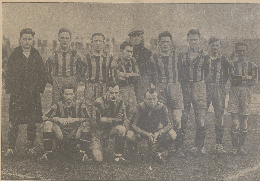
Drużyna L. K. S. Pogon przed spotkaniem z Hakoah w Wiedniu.

Może! W takim jednak razie cała ta sprawa nie wróży najlepszej przyszłości dla amatorskiego piłkarstwa, może bowiem łącznie posłużyć dla innych jako przykład łakomy.