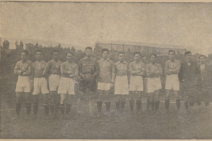
Drużyna Hakoah (Wiedeń) przed grą z Pogonią.

cały dzień, a dość zimne niebiosa osuszyły cokolwiek boisko. Gra rozpoczęła się z pół godzinnym spóźnieniem, bo było jeszcze dużo publiczności przy kasach. Silny skład Hakoahu i liczni bardzo jego zwolennicy liczyli na wysokocyfrowe zwycięstwo, chcąc nie tylko pokazać swą wyższość wobec Pogoni, ale też wobec Simmeringu, który z wielką dozą szczęścia wygrał 1:0.