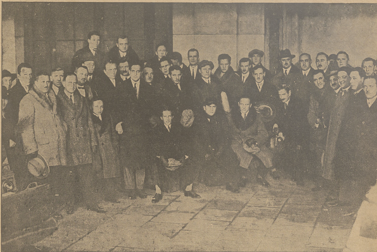
Pogoń w Wiedniu. Powitanie na dworcu kolejowym przez drużyny wiedeńskie.