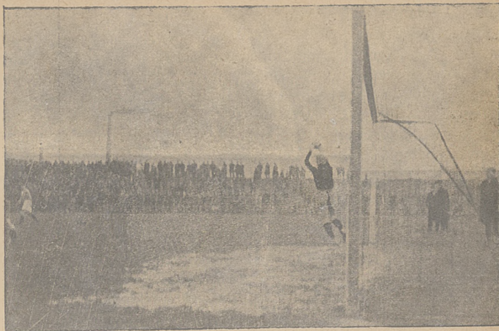
Moment z zawodów Pogoń—Hakoah 2:2.