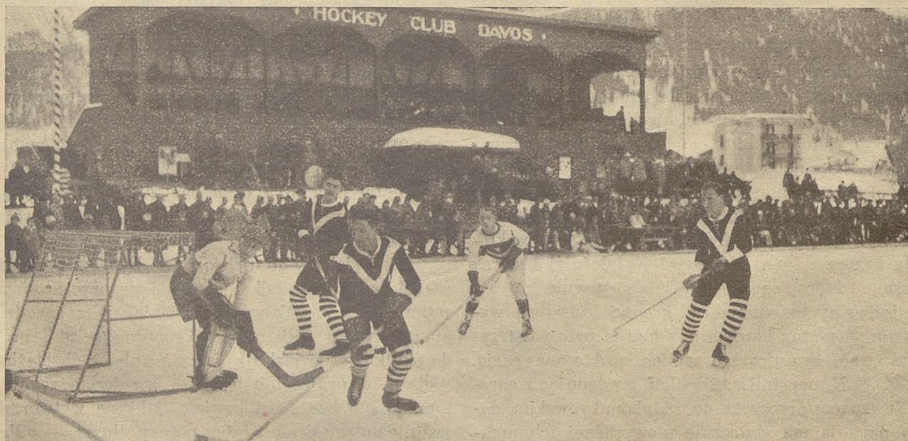
Adamowski atakuje bramkę austriacką.