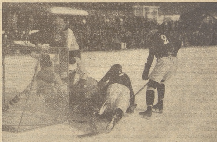
Stos ciał pod bramką angielską przykrywa krążek.