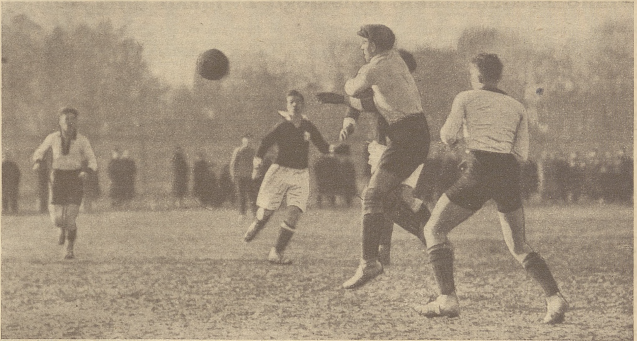
Bramkarz Ruchu w opałach.