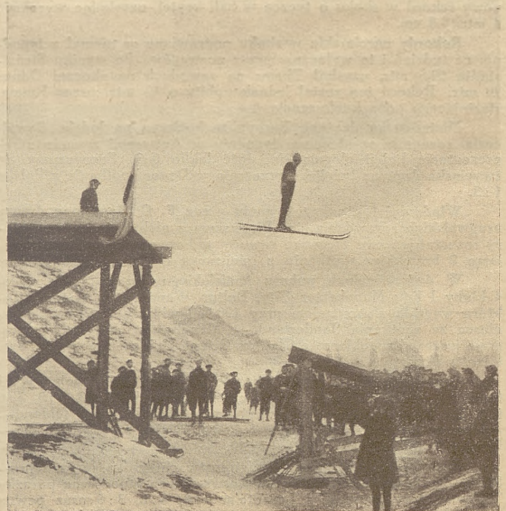
Zawody narciarskie o mistrzostwo Lwowa.