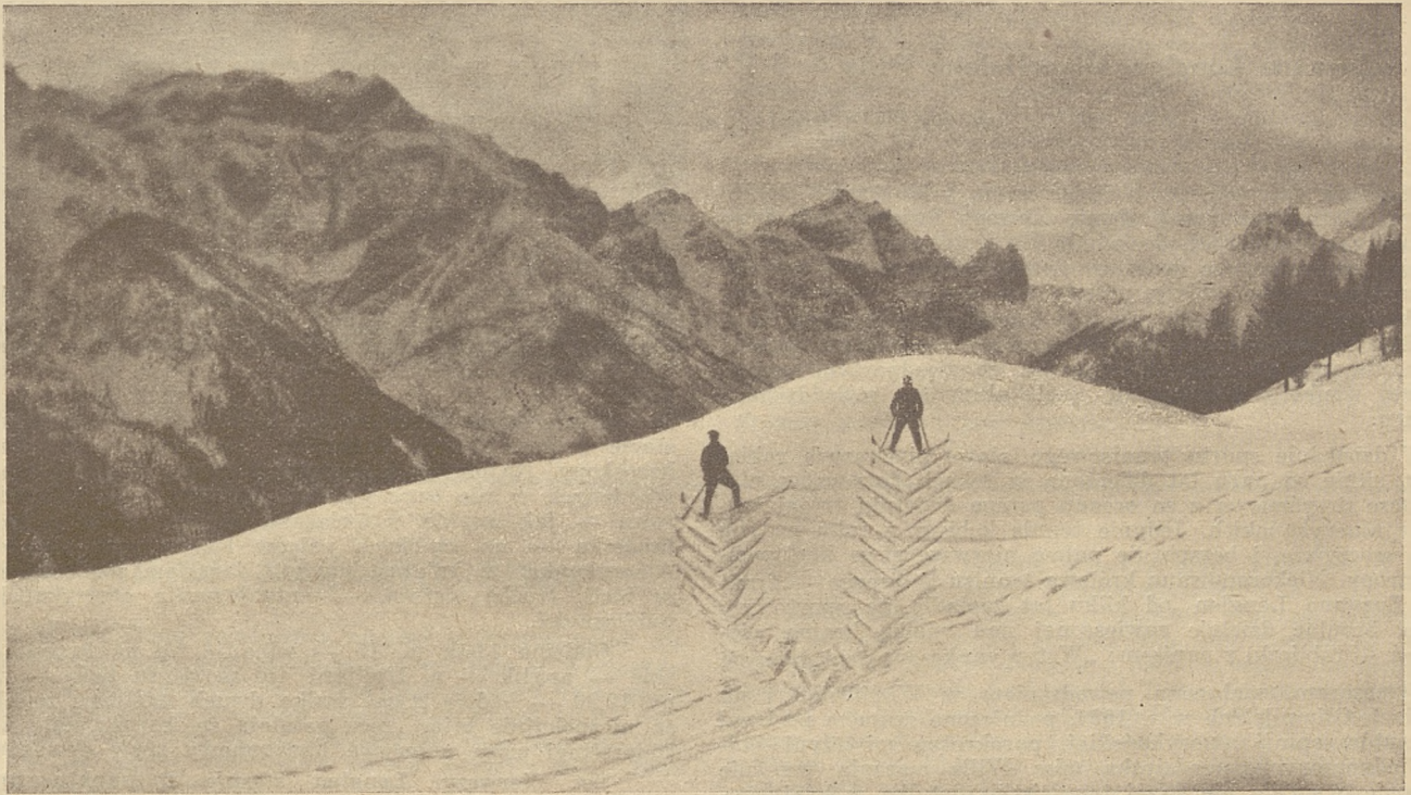
Charakterystyczny ślad narciarzy wspinających się do góry.