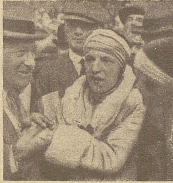
Zuzanna Lengnen (Fr.)

Lenglen wyrównywa. Potem już za każdą grą zmienia się obraz walki i za każdą grą zmieniają się twarze widzów. Wills prowadzi 4:3. Zuzanna wyrównywa. I znów Wills górą — 5:4. I znów, w śmiertelnej ciszy, francuska czterema piłkami ratuje się od przegrania seta a nawet prowadzi 6:5, i... 40:30! Wreszcie jeszcze jedna piłka — główny sędzia ogłasza ją za dobrą (na korzyść Lenglen), a więc set - match. Wskutek reklamacji jednak sędziego autowego, piłka ta zostaje unieważniona, a mecz wznowiony. Zdenerwowana nieoczekiwanym zwrotem w grze, Zuzanna przegrywa game'a. Stan gry brzmi 6:6. Wydawało się, — że set dla Zuzanny stracony. Nie. Dwie następne gry, zdobywa znowu ona, wygrywając ostatecznie set i match.