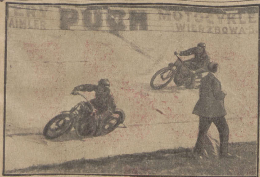
START TRAGICZNEGO WYŚCIGU

Niepokonany motocyklista warszawski, wielokrotny mistrz Polski, uległ tragicznemu wypadkowi w ubiegłą niedzielę na Dynasach, o czym piszemy na str. 2