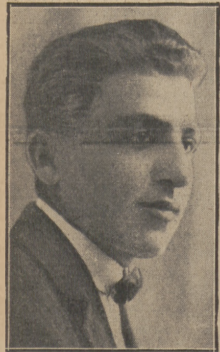
SZYRZYM wybitny piłkarz Hasmonel w Łucku

polecą J. Futerma Marszałkowska 135. telef. 126-28.