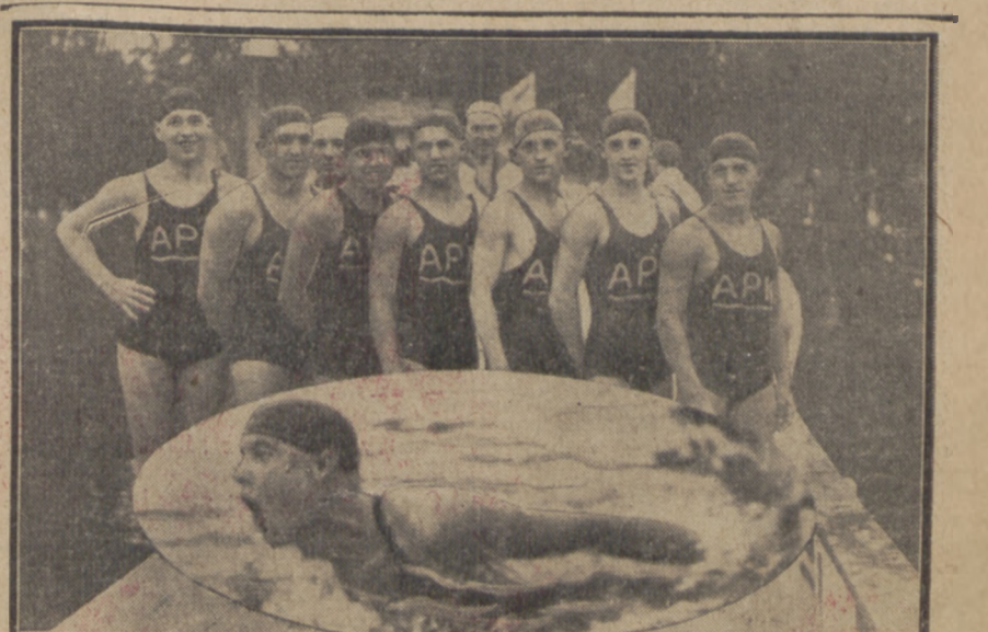
PLYWACY CZESCY W WARSZAWIE

fenomenalny wieloboiata fiński ustanowił nowy rekord świata w dziesięcioboju, osiągając nienotowaną dotąd ilość 8018.99 punktów