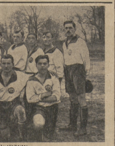
R. K. S. WIDZEW Łódzka drużyna piłkarska jest obok Sk y warszawskiej najlepszym zespołem robotniczym w Polsce