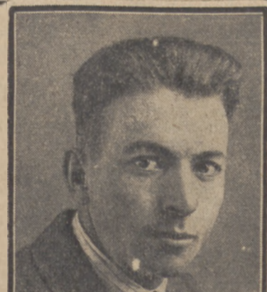
FRANTZ triumfator tegorocznego Tour de France osiągnął fantastyczną przeciętną 27 km./godz.