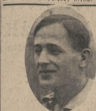
ŚLEDZ (L. K. S.) wzmocnił znów atak wicemistrza Łodzi

100 m. st. dow. pań. Nowe zwycięstwo niezmordowanej Kajzerówny, w czasie 1:42.8, 2) Trałowa, Pol. 1:51.2, 3) Nowakówna, A. Z. S., Kraków. 200 m. st. klas. panów. Po wycofaniu się Kratochwili, wygrywa Jurkowski, Pol. po ostrej walce z Kotkowskim, A. Z. S. Czas zwycięzcy 3:15.2, bliski je-