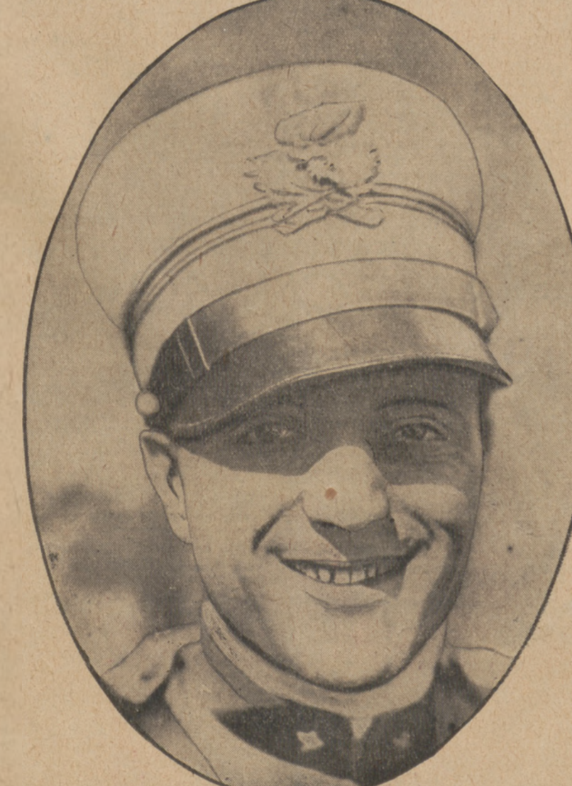
MARIO DE BERNARDI najszybszy łotnik świata osiągnął zawrotny rekord 520 klm. na godzinę