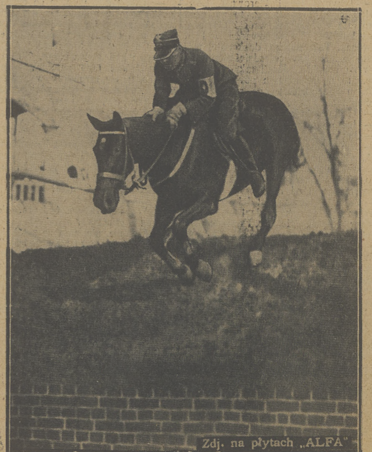
Zdj. na płytach „ALFA”

szosowy tenisista gości niemieckich, którzy ulegli warszawianom 3:6.