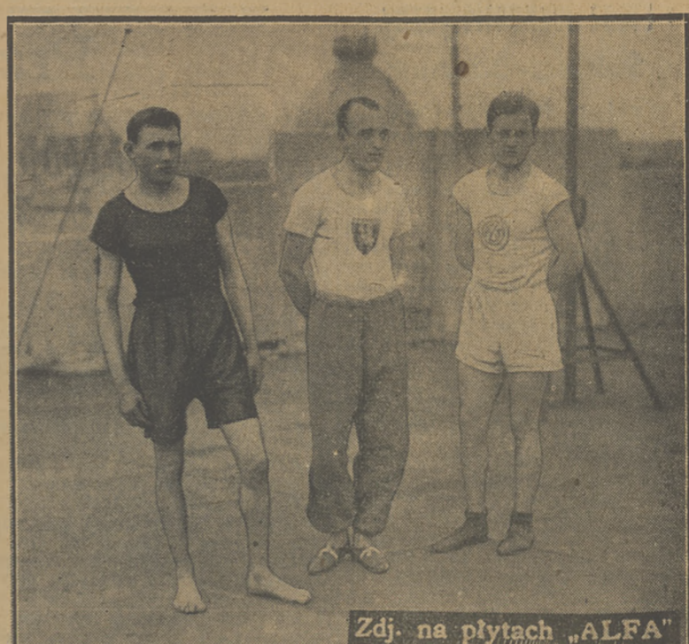
Zdj. na płytach „ALFA”

Wenzel (Katowice), Sawaryn (Lwów) i Motyka (Kraków) zajęli trzy pierwsze miejsca w biegu 100 m. Kurjera Codziennego.