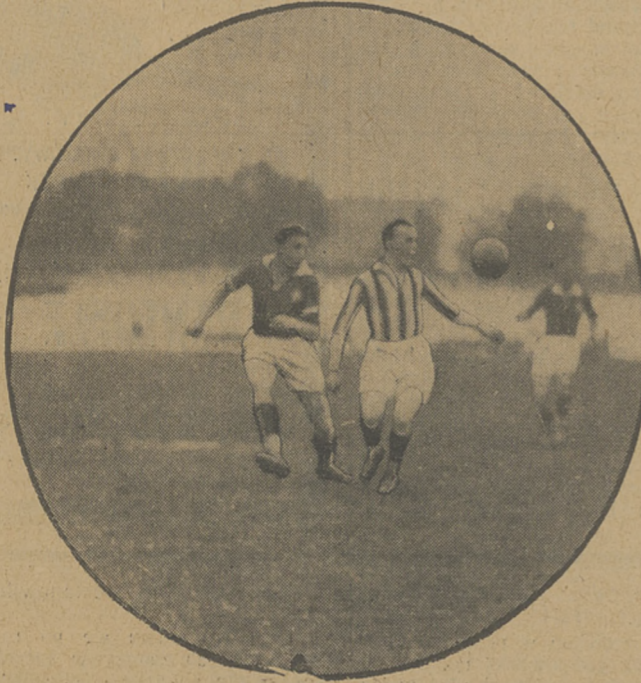
CRACOVIA — WISLA 2:1