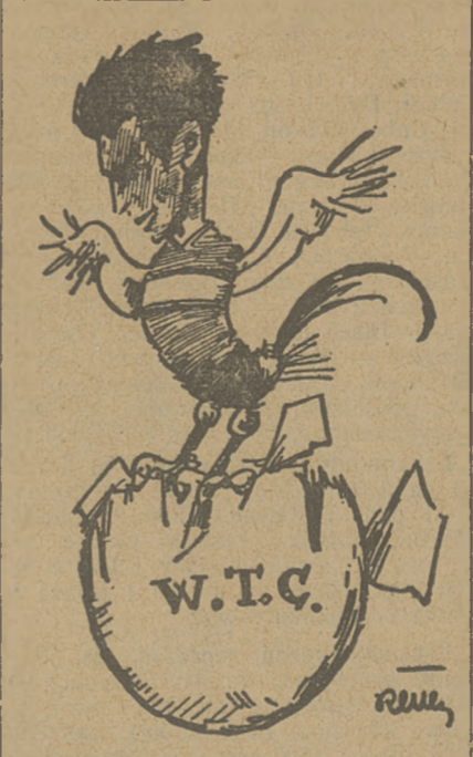
OKSIUTYCZ piskle olimpijskie W. T. C.