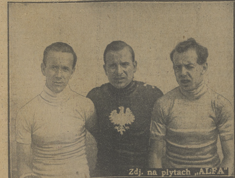
Zdj. na płytach „ALFA”

ASMONEA — WARSZAWIANKA 3:0. W niedzielnym meczu rozegranym w Warszawie, lwowianie wykazali wyższość nad gospodarzami pod każdym względem.