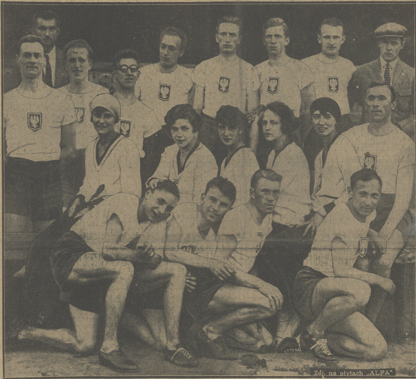
Zdj. na płytach „ALFA”

Pozatem wyjeżdżają por. Gzowski i por. Starnawski, jako jeźdźcy rezerwowi i konie: Hanibal, Oberek, Laskawy Pan, Jówisz, Ładna, Zefer.