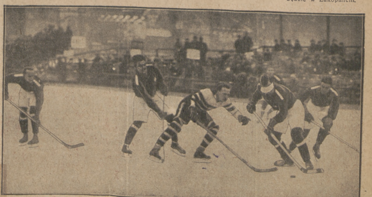
JEDEN PRZECIW PIĘCIU

Najświetniejszy masz technik z krążkiem przy kiju szuka miejsca dogodnego do przeboja.