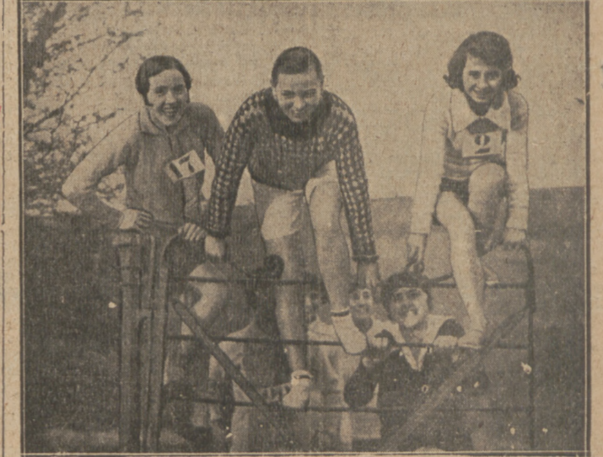
KOBIECY BIEG NAPRZELAJ W ANGLII