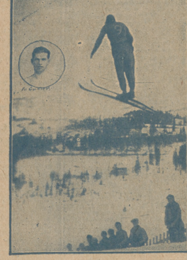
NA ŚNIEGU ZAKOPIAŃSKIM