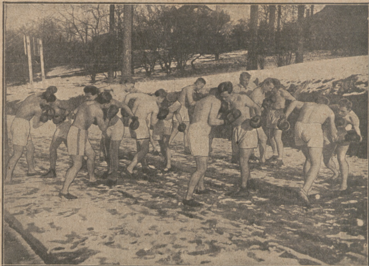
Jedna z berlińskich szkół bokserskich prowadzi zimą nieprzerwany trening na wolnym powietrzu