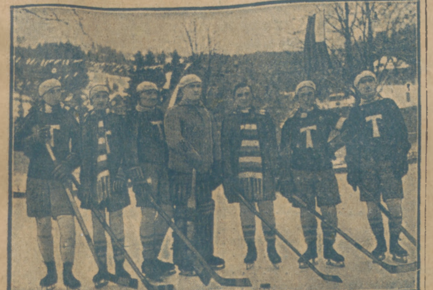
DRUŻYNA HOKEJOWA T. K. S. galaty do najsilniejszych zespołów prowincjonalnych.

Otwarcie poradni sportowo-lek w Wilnie odbyło się dnia 27.1 r. b. w obecności przedstawicieli władz z woj. Raczkiewiczem na czele.