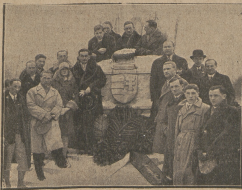
NA GROBIE NIEZNANEGO ŻOŁNIERZA