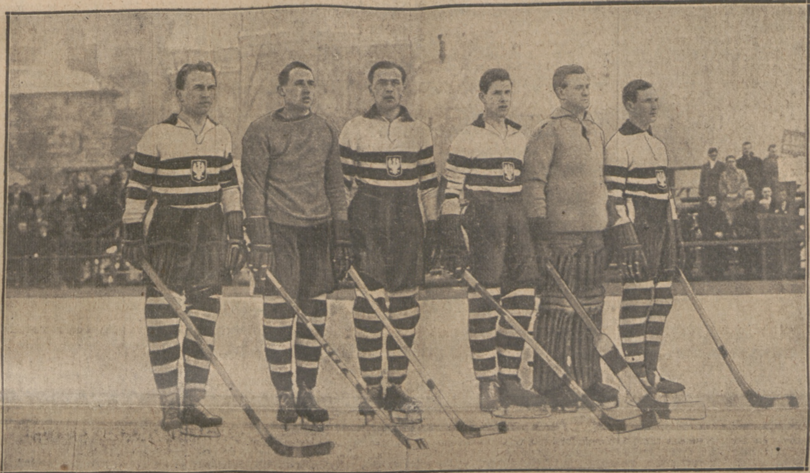
WICEMISTRZOWIE EUROPY PODCZAS POLSKIEGO HYMNU PAŃSTWOWEGO.

Nie tracąc czasu w dniu przybycia udaliśmy się na lod, by rozruszać zbio-