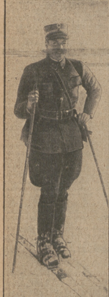
KSIAZE OLAF, norweski następcą tronu uprawia z zamiłowaniem narciarstwo i jest świetnym skoczkim.