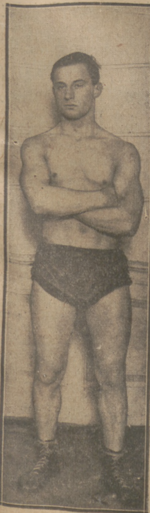
REJNIAK (WARSZAWA) konkował na mistrzostwach zapasniczych Europy Austriacka Masiła.

czołowych świetnie wyskakanych i otrzaskanych w długim szeregu zawodów krajowych i zagranicznych koniach polskich — Gedymini i Doneuse.