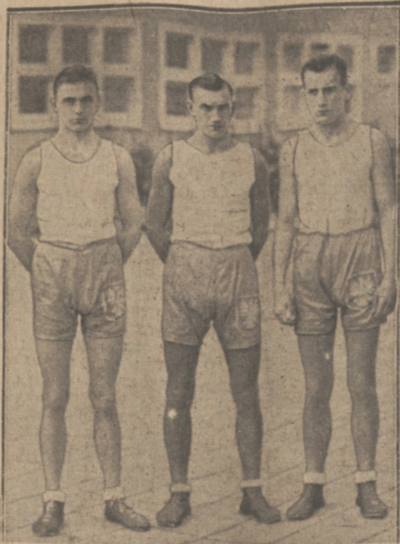
GLON — GÓRNY — MAJCHRZYCKI mistrzowie Polski wagi: koguciej, półkowej i średniej.

który już czterokrotnie reprezentował z wielkim powodzeniem barwy Polski w Nicei, udał się tam i w r. b. wraz ze swymi końmi — Matadorem i Ali.