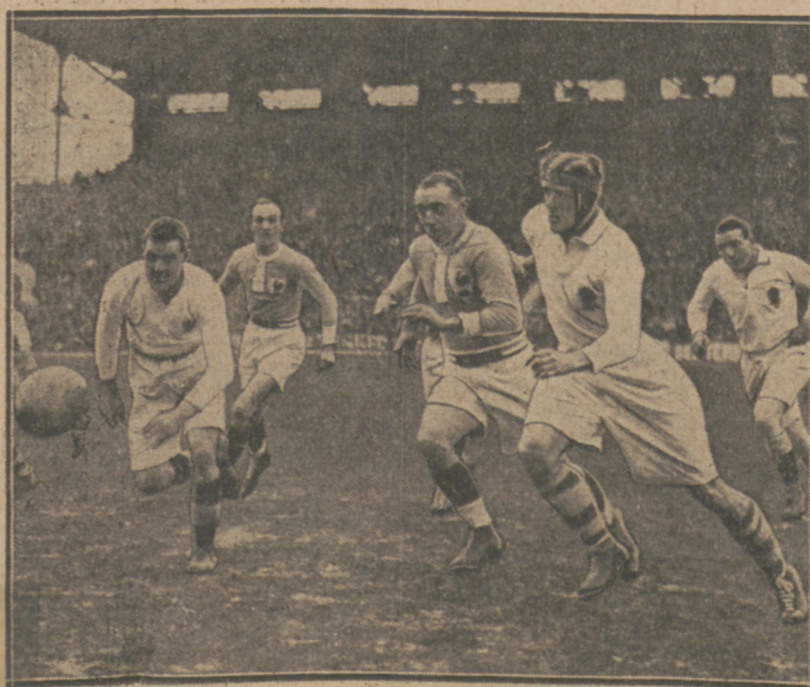
NOWA PORAZKA RUGBYSTÓW FRANCJI. Moment z meczu Anglja — Francja 16:6 w Paryżu. Francja wskutek tej porażki zajela ostatnie miejsce w mistrzostwie Europy.