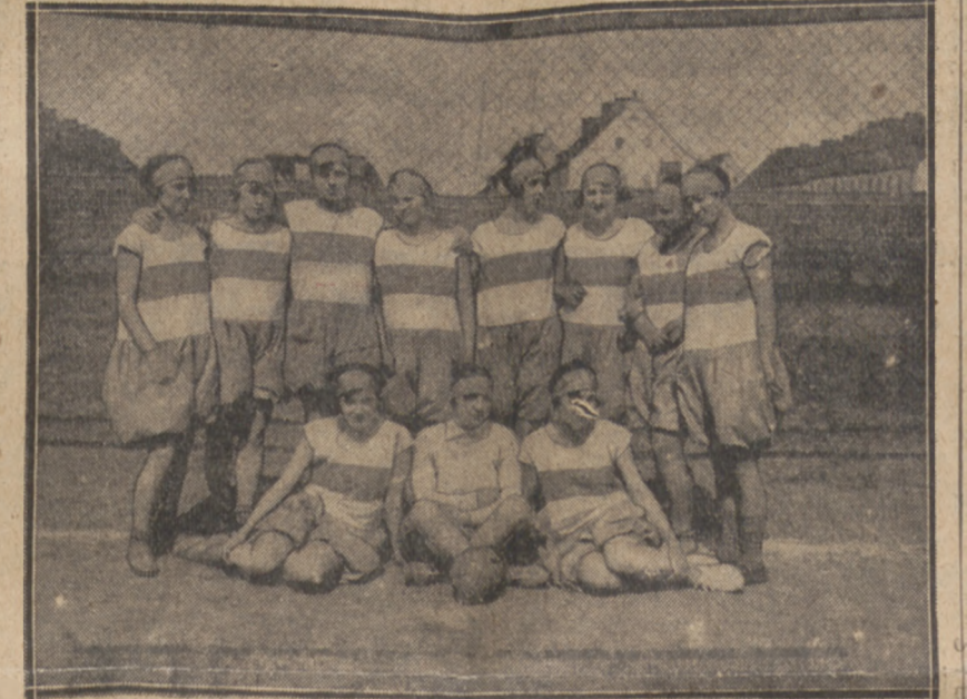
DRUŻYNA PIŁKI RĘCZNEJ GEDANII

o punkty w Lidze gdańskiej jest ciekawą. Przed rokiem zmniejszono Ligę z ośmiu klubów do sześciu, skutkiem czego, prócz ostatniego klubu ligowego, „Większe”, spadł do klasy A także „Ostmark” i nie wszedł do Ligi mistrz klasy A „Gedania”. Ta redukcja, powodowana rzekomo chęcią podniesienia poziomu gry, miała właściwie na celu niedopuszczenie Polaków do Ligi. Obecnie, po ponownym zdobyciu mistrzostwa klasy A przez „Gedanie”, promocji jej do Ligi już nie było można wstrzymać.