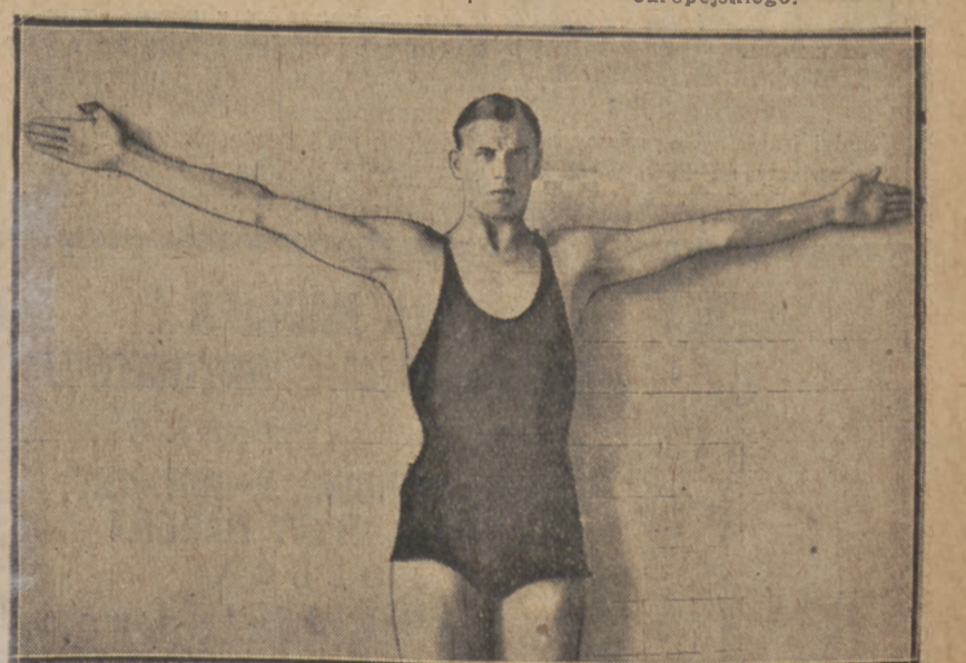
TAJEMNICA SUKCESÓW ARNE BORG

jest największą reweracją pływacką europejskiej.