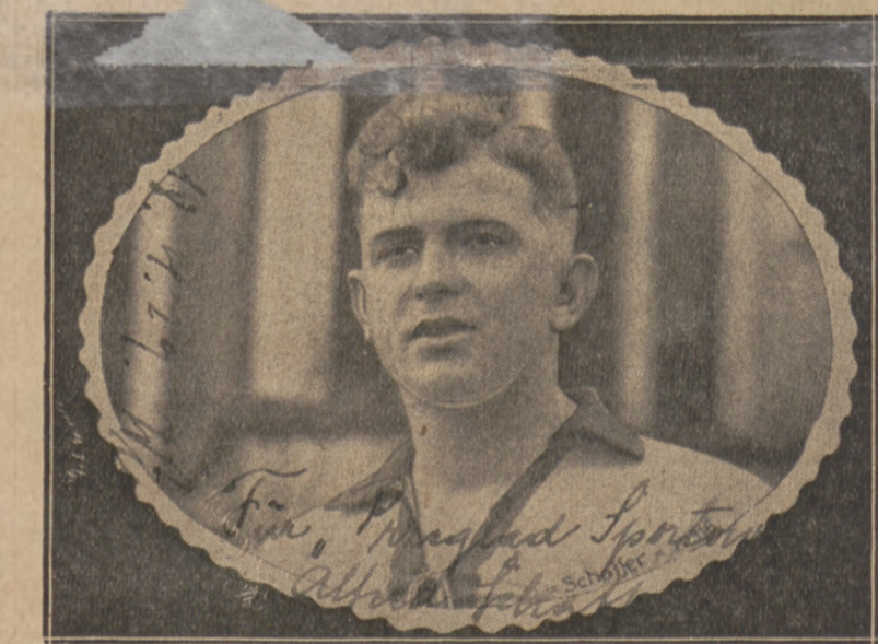
ALFRED SCHAFFER — KRÓL PIŁKARZY

Pan nasuwają się wspomnienia z pobytu w Warszawie, Łodzi i we Lwowie? — Przyjęcie, jakiego doznałem w