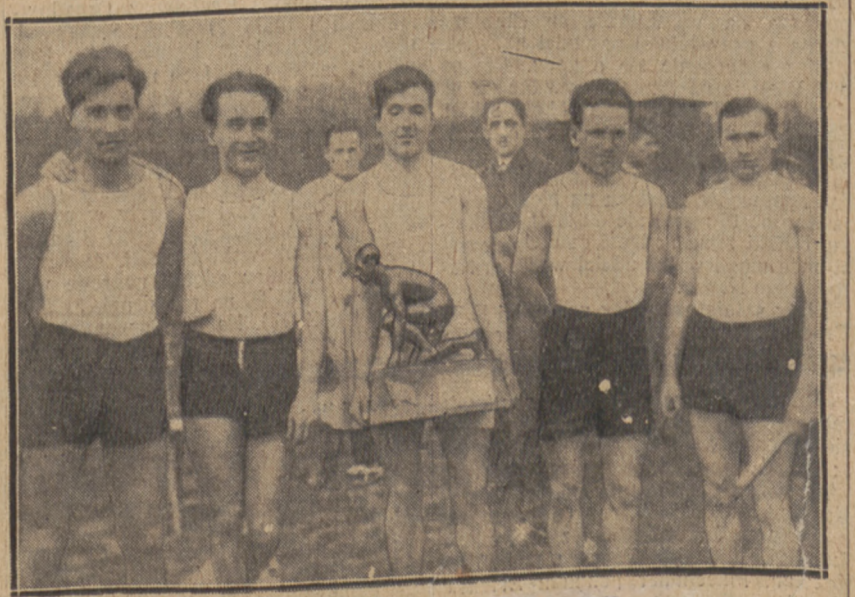
ZWYCIĘSKA SZTAFETA CRACOVII

Wice-mistrz ligi warty Niemcami, przechodzi obecnie okres słabej formy.