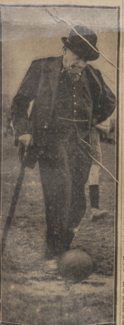
PREMIER BALDWIN rozpoczyna mecz finałowy o puchar amatorski Anglii: Ilford — Leighton.

Kolarski bieg Łódź — Poznań organizuje w czasie P. W. K. (20 maja) Łódzkie Tow. Kolarskie z okazji 40-letniego jubileuszu. Trasa wynosi 240 kml.