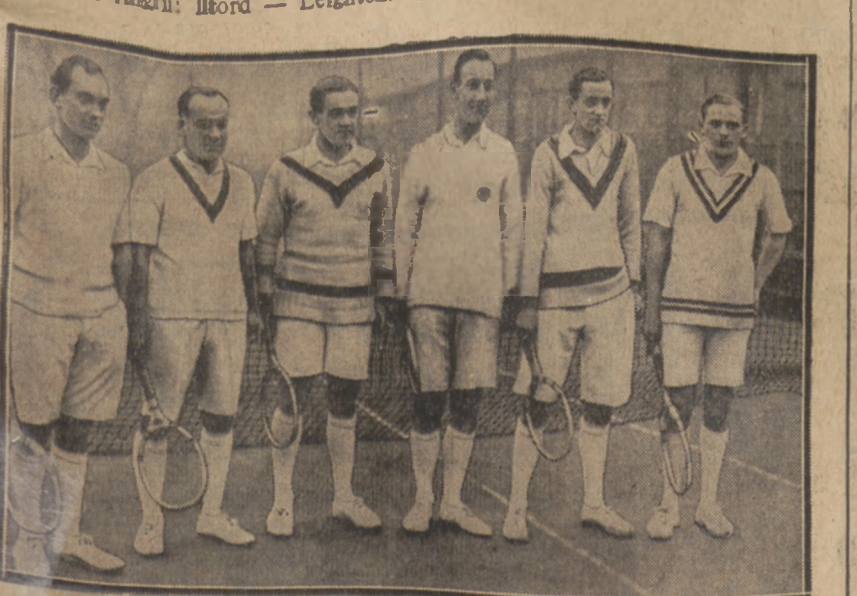
REWOLUCJA W STROJU TENNISOWYM

Ostrowia, jeden z najstarszych po Poznaniu ośrodków sportowych Wielkopolski, obchodzić będzie w dniu 5-maj r. b. 20-lecie istnienia. Głównym punktem uroczystości jubileuszowych będzie tradycyjny mecz piłki nożnej z gimnazjalną drużyną, Wenetia. Ostrowia jeszcze podczas zaboru pruskiego należała do założycieli tow. „Związku Polskich Towarzystw Sportowych”, z którego wyłonił się późniejszy Pozn. O. Z. P. N.