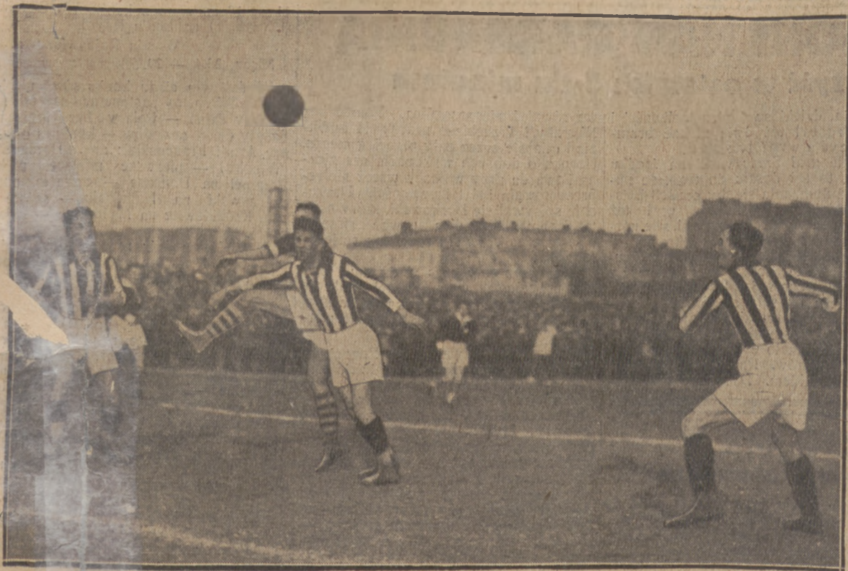
POD BRAMKĄ CRACOVII

Korespondencja z Nicei. Zatař P. Z. P. N-u z Pořkiem Kolegiũm Sędziów. Polska przed występem w grach o puchar Davisa