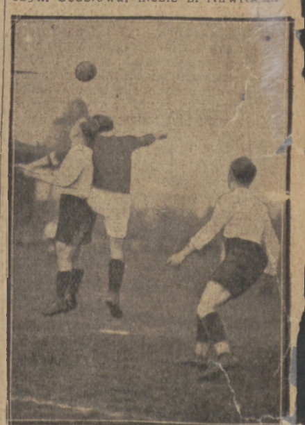
WISŁA — LEGJA 2:0

Goście słaszy, mimo nieznacznej kleski zaprezentowali się bardzo dodatnio. Szybka gra doskonały start i niezłe pociąganie kombinacyjne stnowia ich główne walory. Należy Kusz, Peterek i niezwykle ruchliwy Sobota. U miejscowych w pierwszym meczu wyróżniali się Milla, Kubiak i Janczyk. Sędziował niezłe p. Nawrocki.