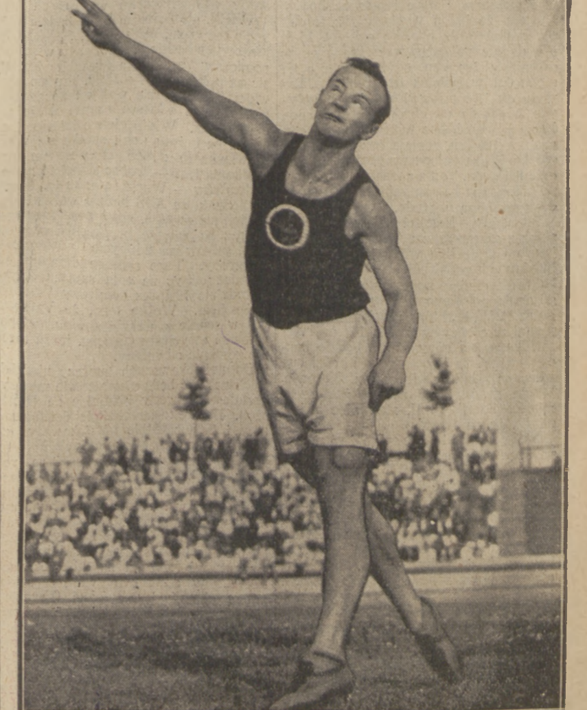
NAJLEPSZY OSZCZEPNIK NIEMIEC Molica z Królewca, zwyciężył w mistrzostwie rzucania oszczepem w Weymannie.