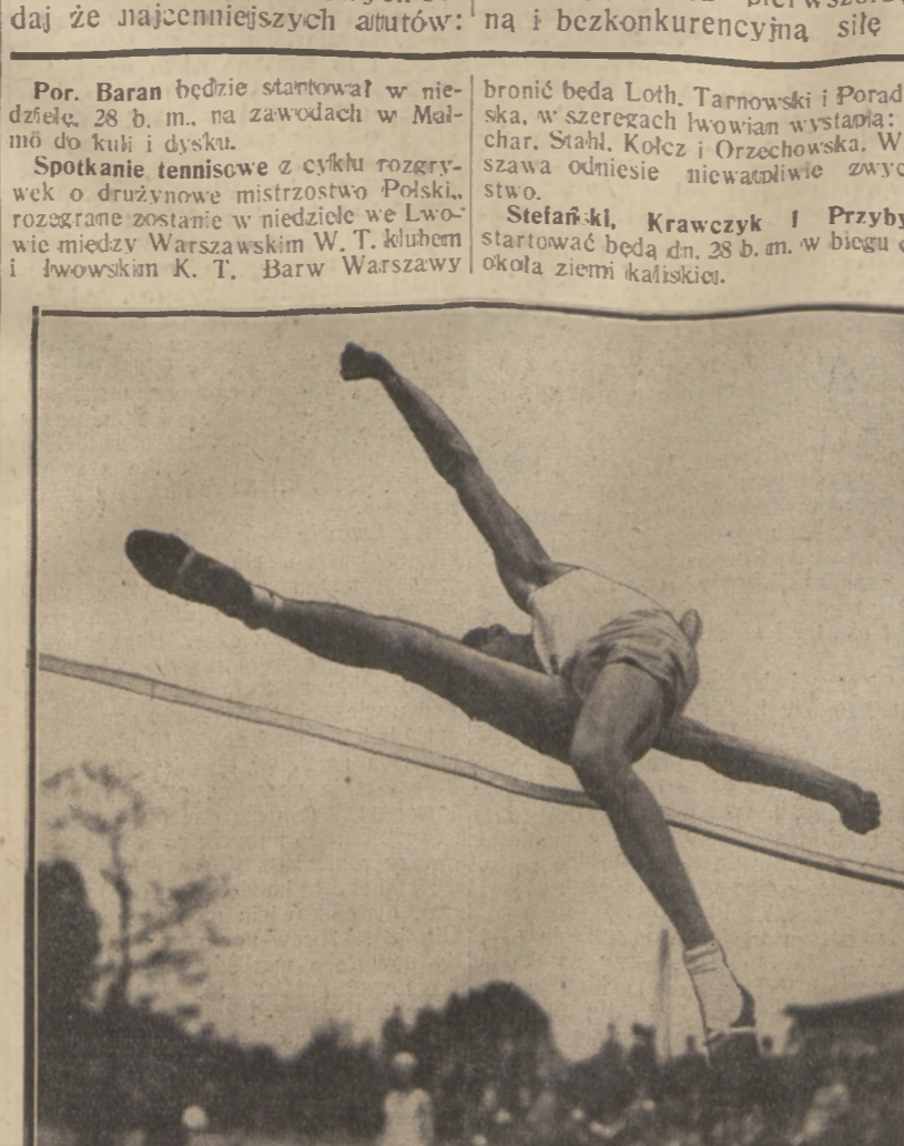
GWIAZDA SPORTU CZESKIEGO Wielki skoczek Mutynek na wysokości 1 85 m nad ziemią.