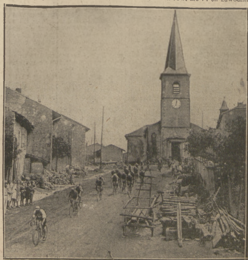
W MIASTECZKU ALZACKIEM

Start zawodników. W awanturze zwycięzca Sobolewski.