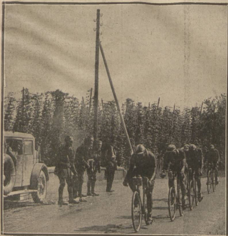
PRZEZ WOGĘZY DO STRASBURGA

Trzynastki nie będzie wśród zawodników, aby pecha nie ciągnąć za uszy. A więc 75 n-rów, ale 74-ch zawodników.