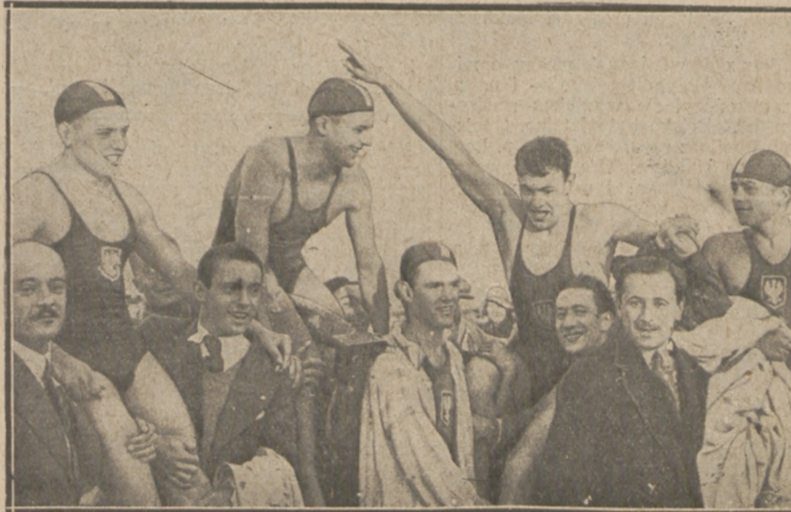
OWACJE DLA ZWYCIĘZCÓW

walnie przyczynił się do wspaniałego triumfu pływactwa polskiego, wygrywając 200 mtr. i świetnie walcząc w sztafecie.