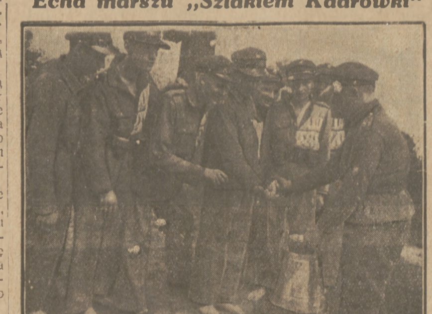
Zwycięska drużyna 21 pp. otrzymuje na postojach cukier. Dzięki odżywianiu się cukrem, który jest najlepszym środkiem na zmęczenie...