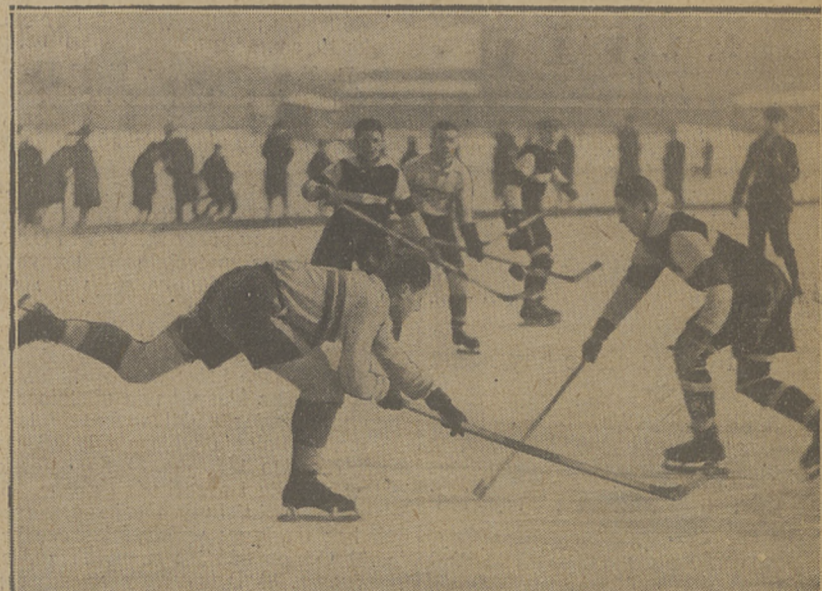
WALKA O KRAZEK Moment z meczu A. Z. S. II — Polonia II 2:2 o mistrzostwo warszawskich klas P.