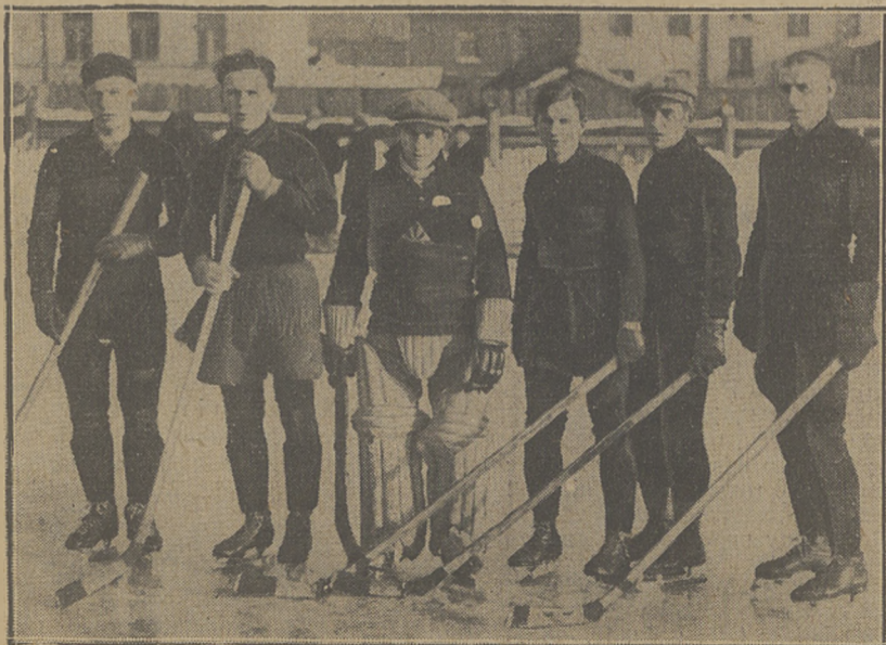
HOKEISCI WARSZAWSKIEJ SKRY wybili się od razu na czoło zespołów robotniczych, odnosząc pełnowartościowe zwycięstwo nad Warszawianką 5:2.