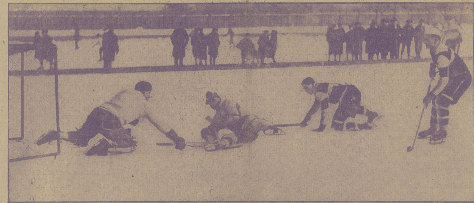
NA BOISKU HOKEJOWYM POLONJI Emocjonujący moment z meczu A. Z. S. II — Polonia II 2:2.

Belgia odmówiła przyjazdu. Przed kilku dniami Ligue Belge de Patinage sur Glace przesłała do PZHL strasznie długi list, w którym z rozpaczą w głosie stwierdza niemożliwość przyjazdu do Krynicy z powodu zupełnego braku możliwości treningu.