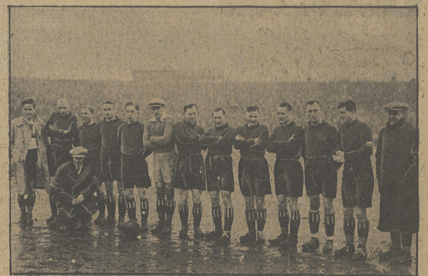
DREZNO GROMI BERLIN 5:2 dowodząc swej wysokiej klasy piłkarskiej i... słabej formy Berlina.

Przenumerata kwartalna zł. 7. Cena ogłoszeń: za wiersz wysokości 1 m/m. szerokości szpalaty red. w tekście zł. 0.80, noza tekstem zł. 0.40.