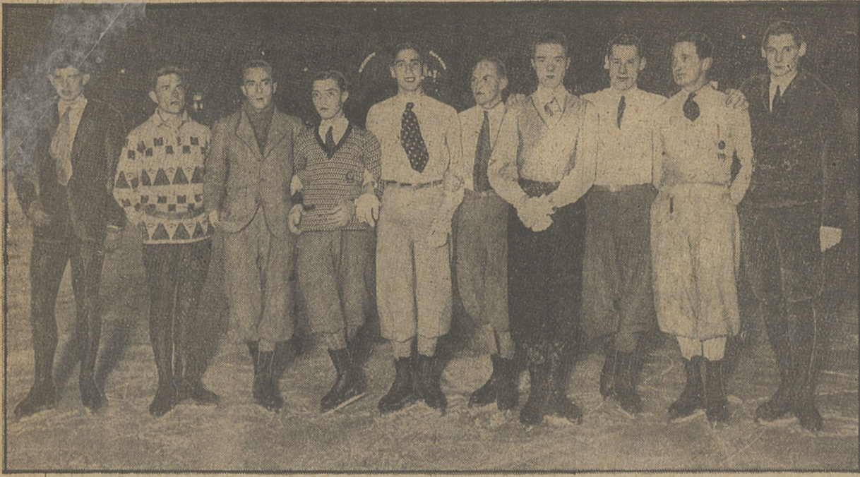
MISTRZOWIE IAZDY NA LODZIE W BERLINIE

zdobywają ponownie indywidualne mistrzostwa świata w jeździe figurowej