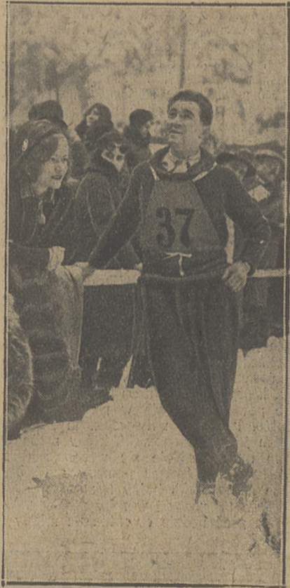
GROTUMSBRATEN zwyciężył bezkonkurencyjnie na zawodach w Holmenkollen.