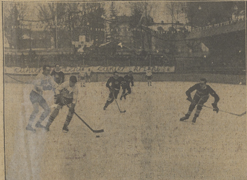
STANY ZJEDNOCZONE — AUSRIJA 2:1 Ramsay (USA) odebrał krążek Trautenbergowi (Austria).

Enkes, Fozas, Szabo i Szgeti stanowia trzon reprezentacji na meczu z Polką w Poznaniu.