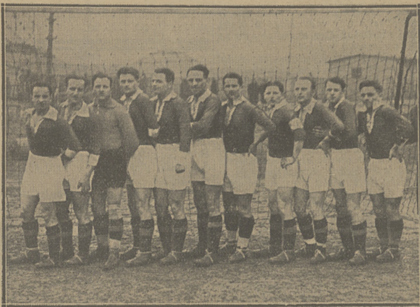
WARTA POZNAŃSKA. jeden z najwybitniejszych i najbardziej stylowych polskich zespołów ligowych w r. b. stanęła do boju w mocno osłabionym składzie

W niemałej mierze do obniżenia wyników przyczyniło się też