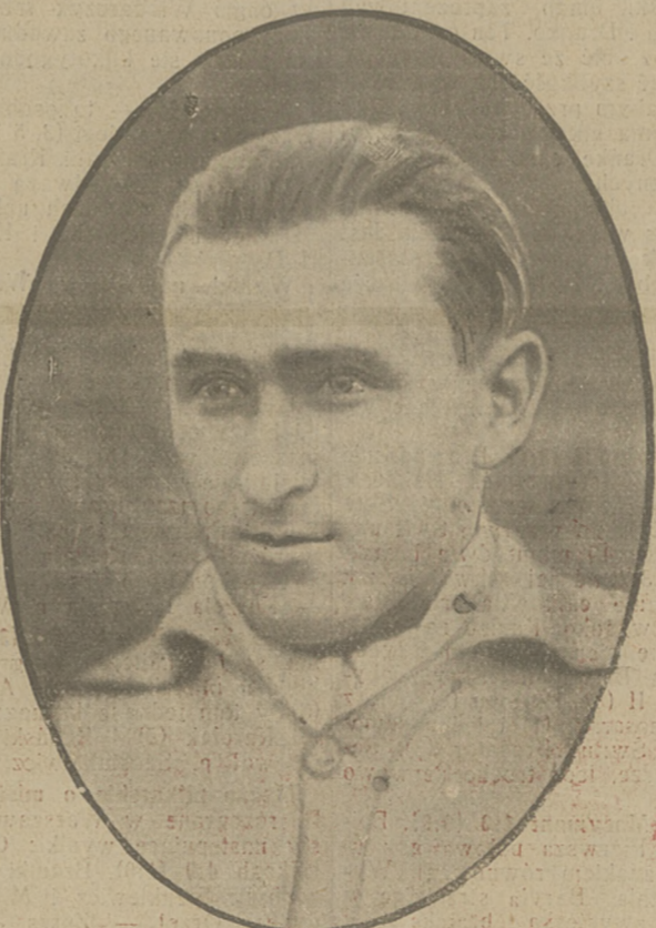
JANUSZ KUSOCIŃSKI dopisał wreszcie swego celu, bijąc w Antwerpii pierwszy rekord świata (Nurmiego) na dystansie 3 klm. w czasie 8 m. 18,8 sek.