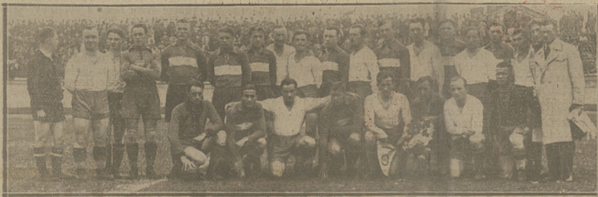
PIEKARZE RAPIDU (WIENIEN) I LE GJI PRZED MECZEM W WARSZAWIE 4:1

Szeroko i daleko, jak szeroki cały świat sportowy rozbrzmiało ponownie imię polskie — i to podwójnie: Kusociński w Antwerpii i Weissówna w Łodzi ustanowili nowe rekordy światowe. Znamy już uczucie radości i dumny, kiedy sportowi polskiemu przypada w udziale pierwszeństwo przed światem, kiedy zwycięzca polski wzbija się na wysokość niedosięgnięta dla innych. Po raz pierwszy uczuć tych doznaliśmy cztery lata temu, kiedy podczas Olimpiady w Amsterdamie rzut dyskiem Konopackiej wytknął granicę sprawności kobiecej. Dziwne doprawdy zrzadzenie losu sprawia, że teraz po raz drugi w tej samej dyscyplinie potarza się ten sam triumf polski: Weissówna rzuciła 42,43 mtr., bije swój poprzedni rekord światowy o dwa metry i o tę znaczną odległość wysuwa się