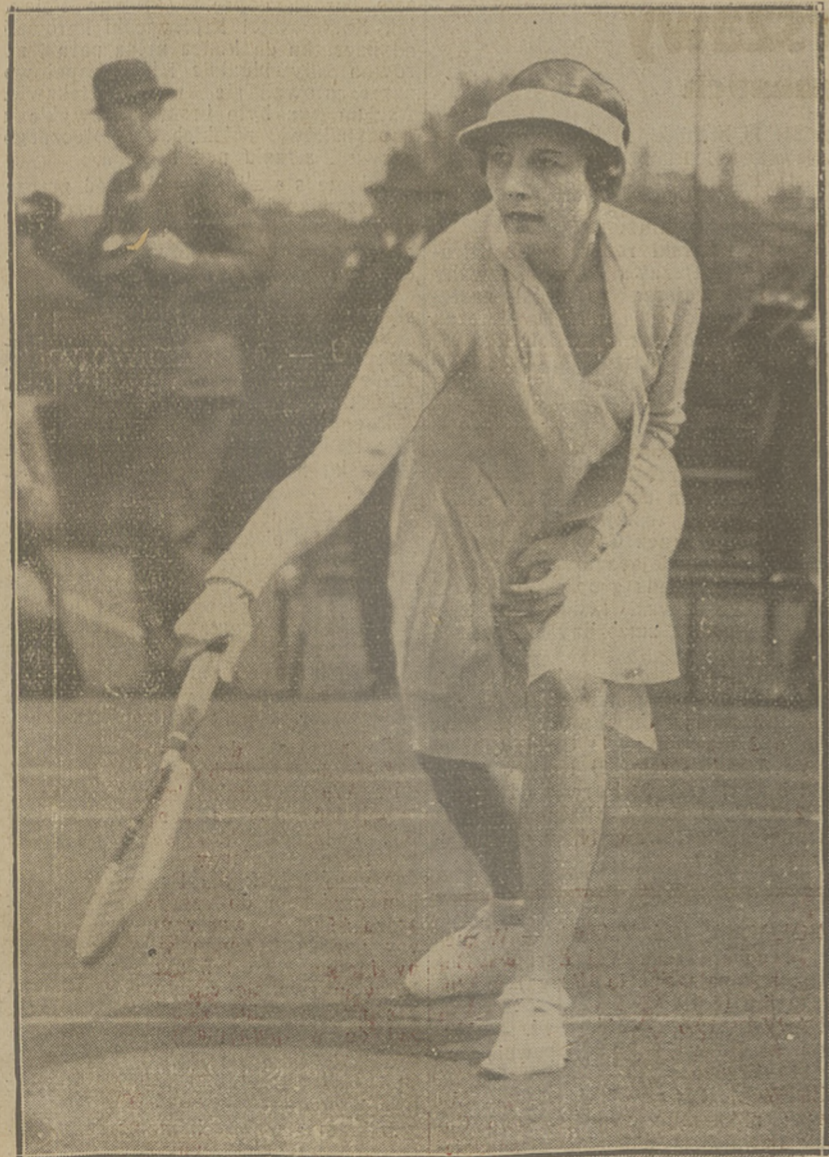
PIERWSZA RAKIETA ŚWIATA Amerykanka Wills-Moody uchodzi zgóry za bezapelacyjną triumfatorkę Wimbledonu, gdyż w tym roku nie straciła jeszcze ani jednego seta.