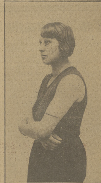
WEISSÓWNA nasza rekordzistka świata w rzucie dyskiem jest atutem Polski na Los Angeles.