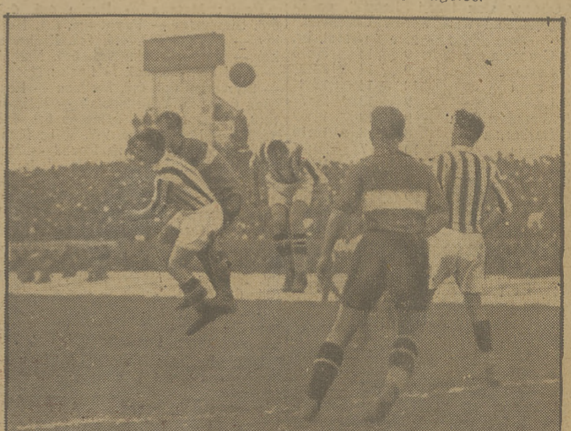
CRACOVIA — RAPID 2:2. Korner pod bramką krakowian. Do piłki skaczą: Lasota, Wieruski i Wesselik.