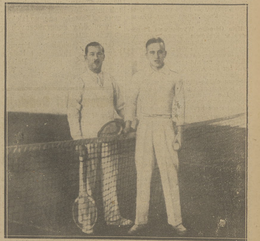
PO TRENINGU ZIMOWYM

podczas niedzielnego biegu inauguracyjnego sezonu narciarskiego.