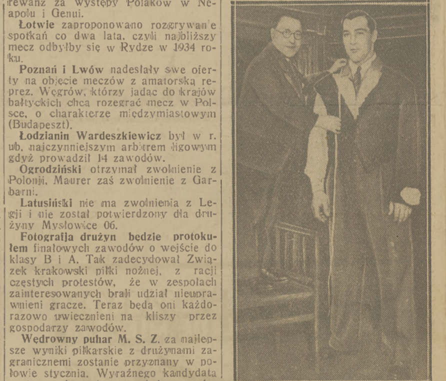
KŁOPOTY CARNERY Olbrymi bokser wydaje masę pieniędzy na krawców, którzy słono liczą sobie... ryzyko przymiarki ubrania.