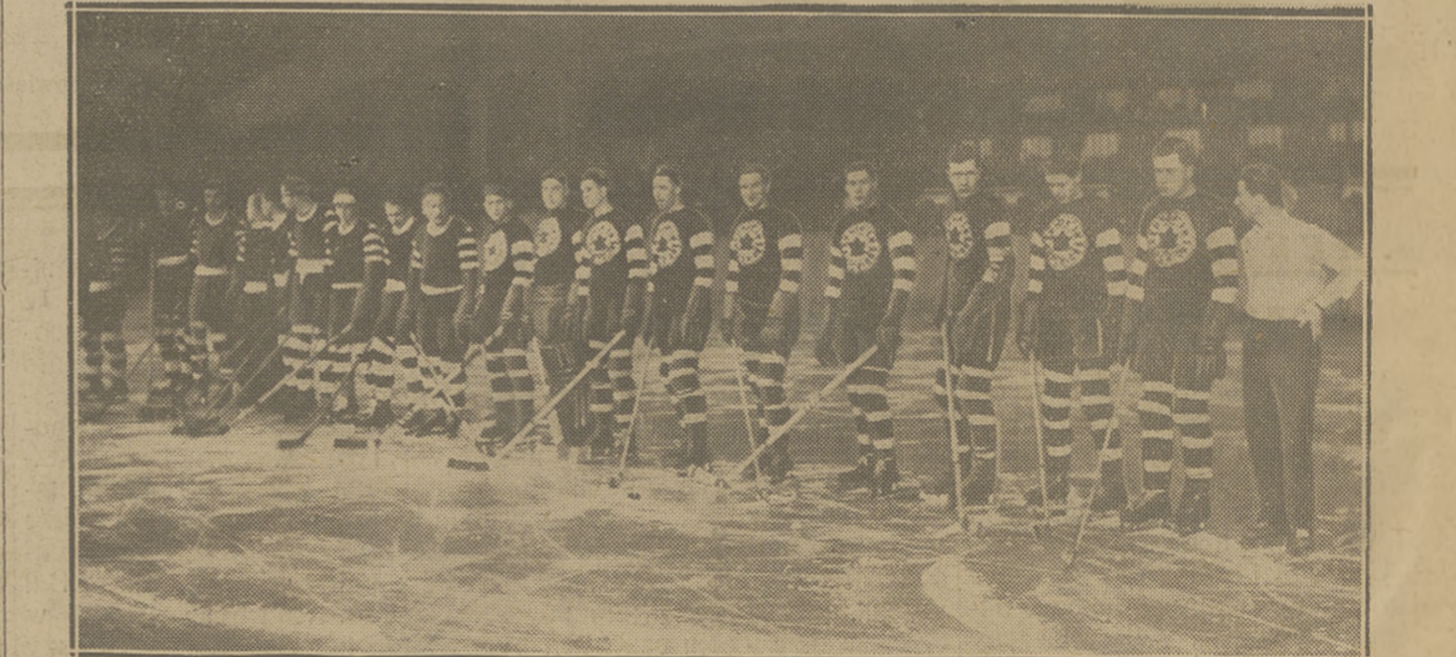
DRUŻYNA EDMONTON SUPERIORS Z KANADY na szlucznym torze Berlina, gdzie zwyciężyła Niemcy 7:1 i 5:1.