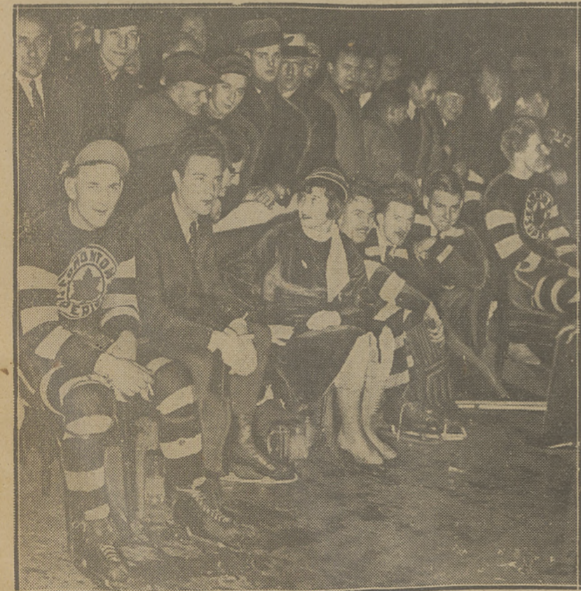
KANADYJCZYCY W BERLINIE