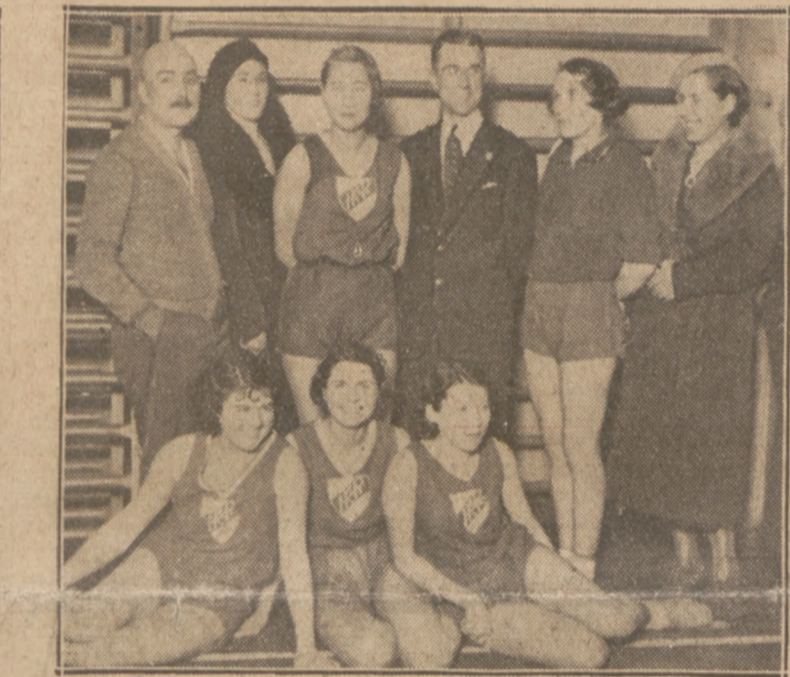
KOSZYKARKI I. K. P. ŁÓDŹ zdobyły mistrzostwo i zakwalifikowały się do pucharu P. Z. G. S.

Ale potem wszystko poszło niespodziewanie jak z płatka. Po przez zwycięstwa 3:2 nad Włochami i 4:0 nad Francją dotarli Niemcy do decydujących rozgrywek. Wreszcie, w szczęśliwie zakończonych