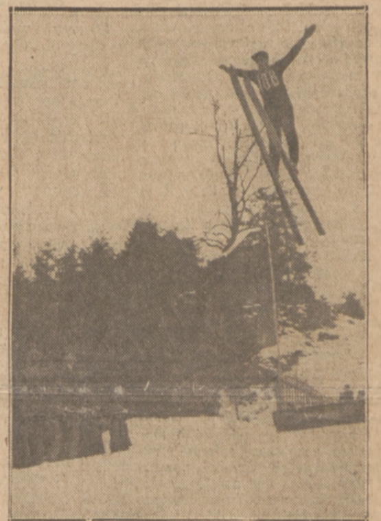
zapewnia sobie 2-gie miejsce w kombinacji.