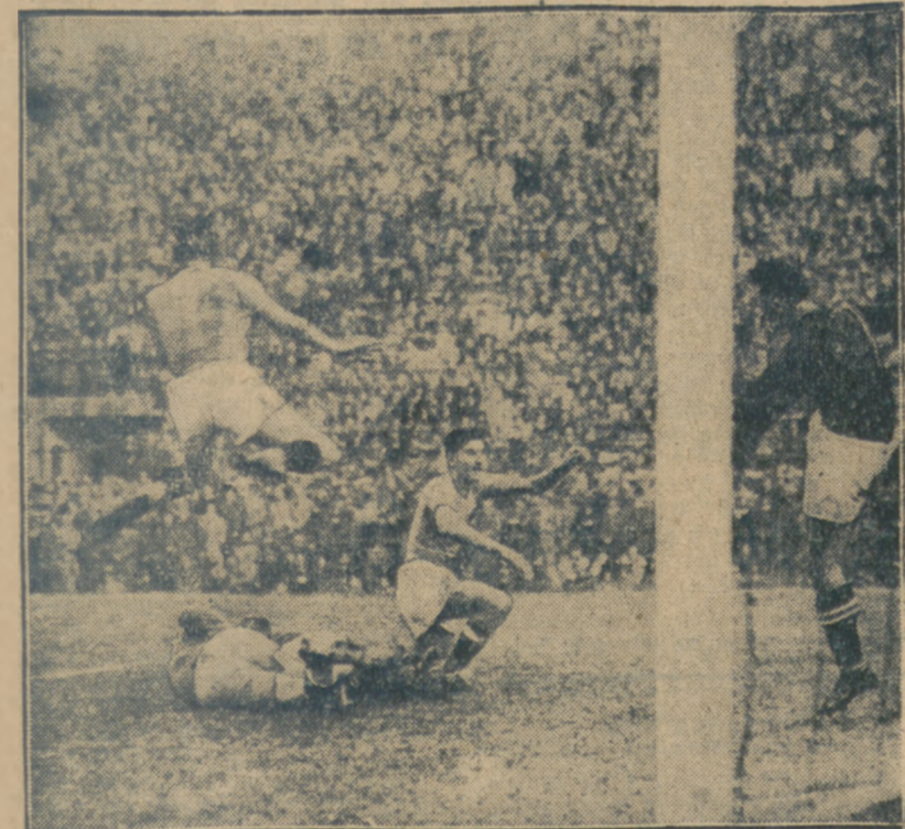
TAK ATAKUJĄ WŁOSI!

Szalony wypad „Azzurich” stawia bramkarza przeciwnej drużyny stale przed ciężkim zadaniem.