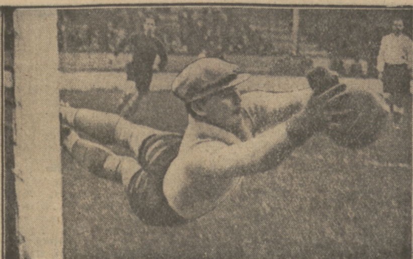
ROBINSONADA JAKICH MAŁO Autorem jej był bramkarz francuski di Lorto.

najszybszy motocyklista świata, na krótko przed startem do próby bicia rekordu światowego przekazał czytelnikom Przeglądu Sportowego swe zdjęcie z autogramem (patrz str. 3-cia).