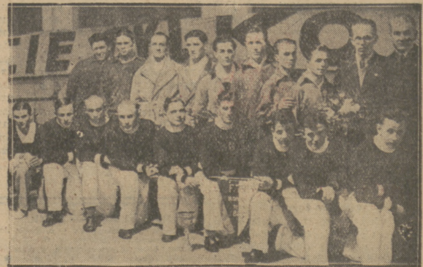
WĘGRZY WE LWOWIE