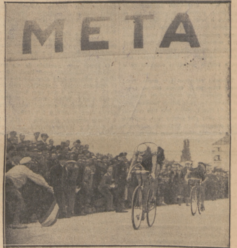
OSTATNI SZPURT KAPIAKA pieczętuje jego zwycięstwo w wyścigu do Morza. Ostatni etap wygrał na finiszu przed Gotąbem.

— Podobno istniał projekt, że skład na Polskę miał być zestawiony z za-