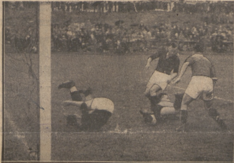
BRUDNY SPRZĄTAŁ PAZURKOWI PIŁKĘ z buta na meczu Wisła — Polonia 3:2.

110 m — PONIŻEJ 15 SEK. W biegu przez płotki 110 m, obaj nasi Olaw i Wegner są w stanie zejść