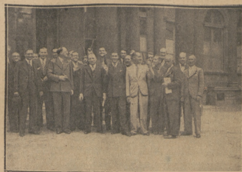
SPORTOWCY FRANCUSCY W AMBASADZIE R.P. W PARYŻU

— murzyn amerykański, skacze 2 mtr na międzynarodowych zawodach w Sztokholmie.