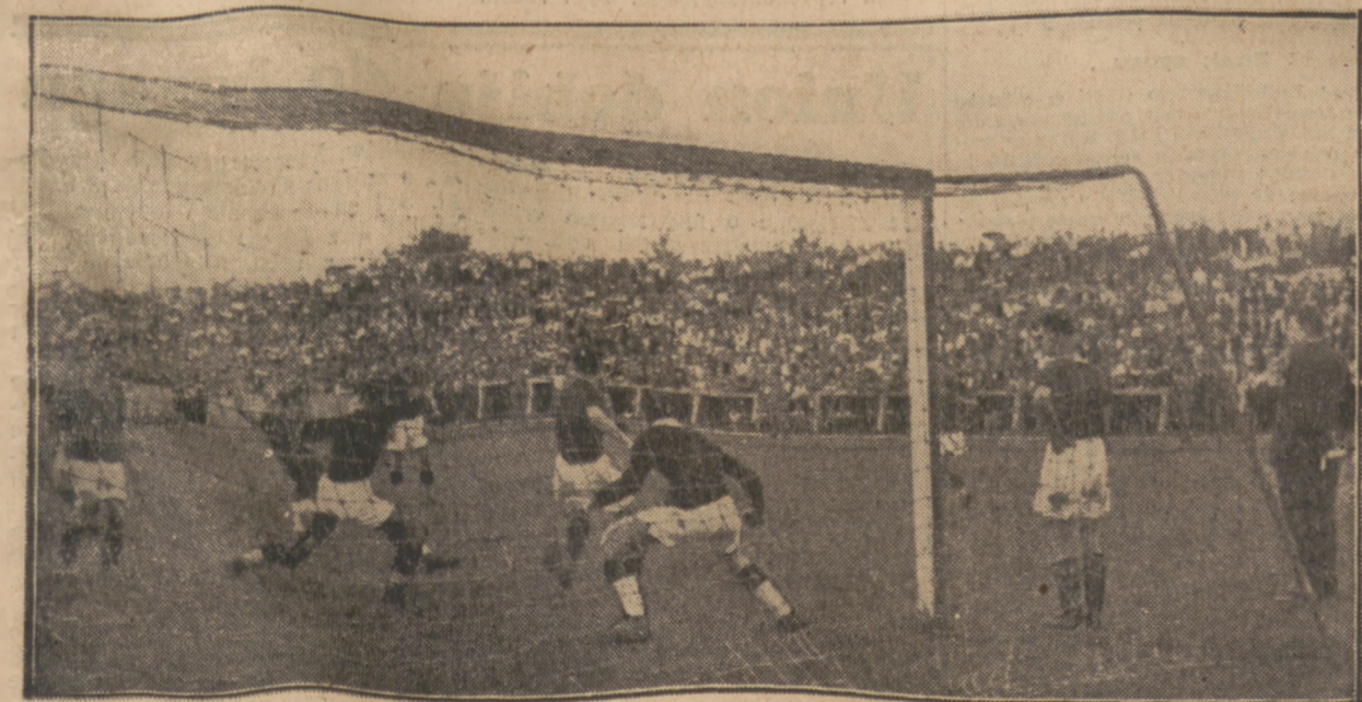
ZNÓW BEZ REZULTATU!

NOWY REKORD POLSKI Na mistrzostwach Polski Walasiewiczówna ustanowiła nowy rekord w skoku w dal z miejsca 2,60,5 mtr.