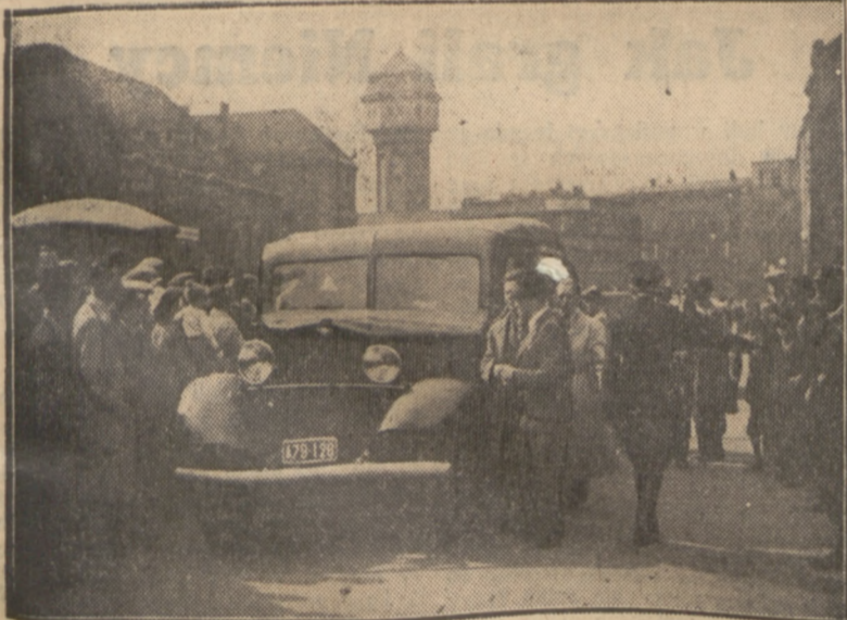
W AUTOBUSIE POLICYJNYM rozsiada się reprezentacja piłkarska Polski, goniąc pociąg zdążający do Bytomia.

ZNACZEK OLIMPIJSKI dla uczestników igrzysk w Helsinkach w 1940 roku.