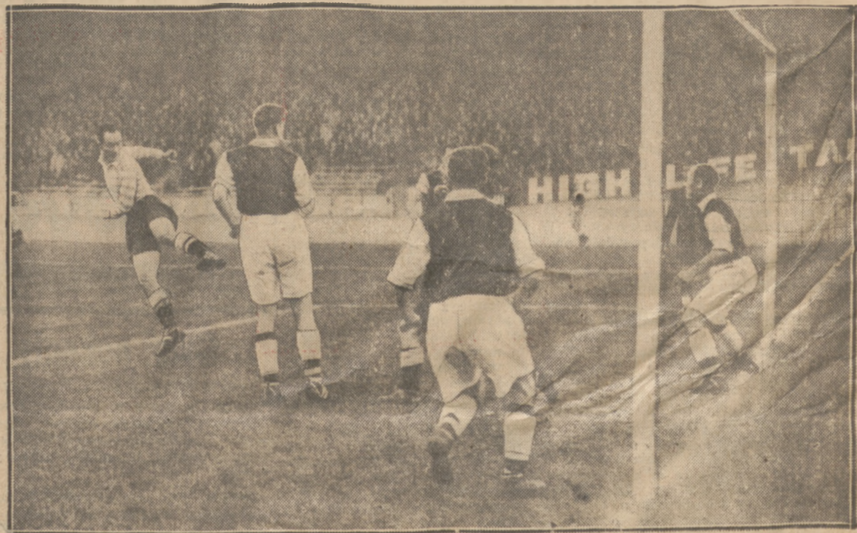
VEINANTE GŁÓWKUJE DO BRAMKI ARSENALU

na ostatnim meczu z Racingiem 1:1 w Paryżu. Bramkarz wybiegł do przodu, lecz zastąpił go natychmiast obrońca.