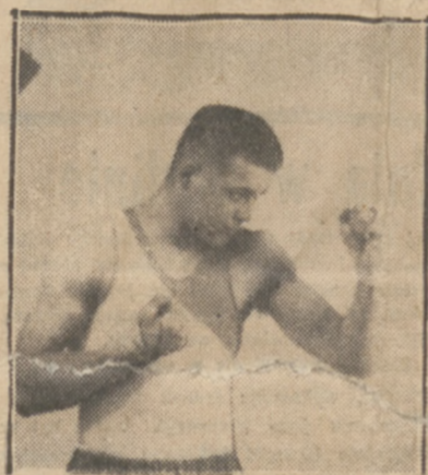
RAADIK super-as boksu estońskiego, przeciwnik Pisarskiego.