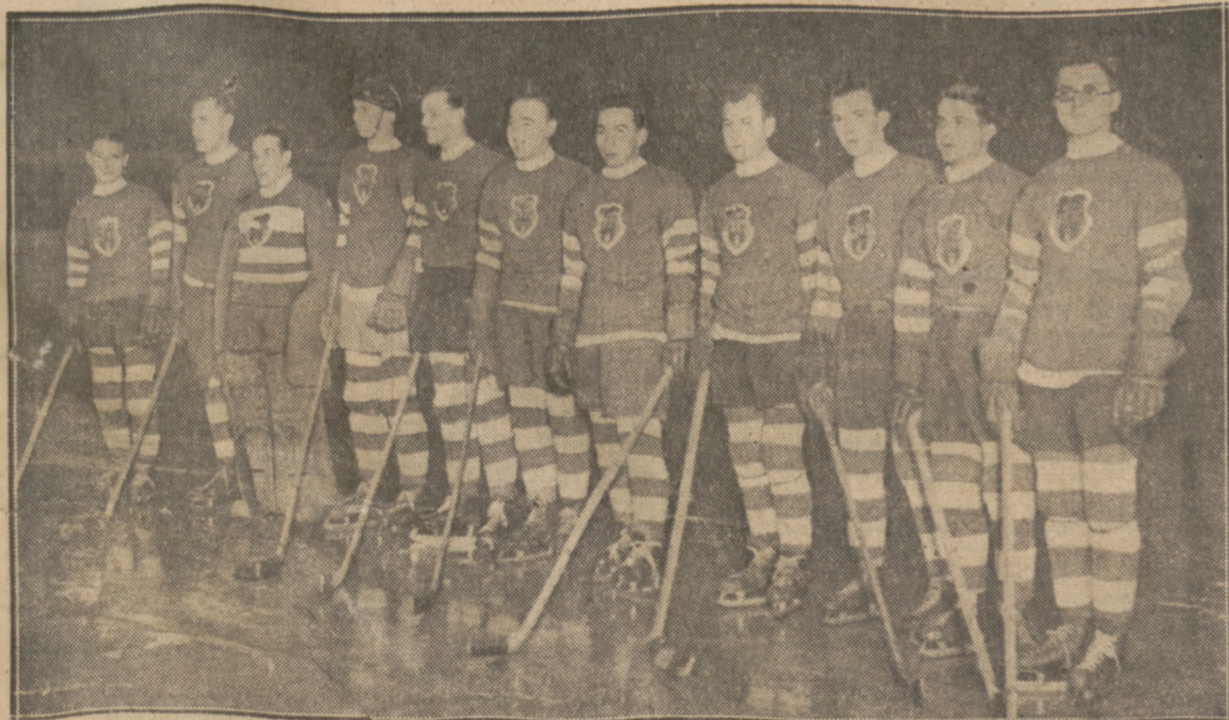
DRUŻYNA KRAKOWA, POKONAŁA W KATOWICACH ŚLĄSK 1:0