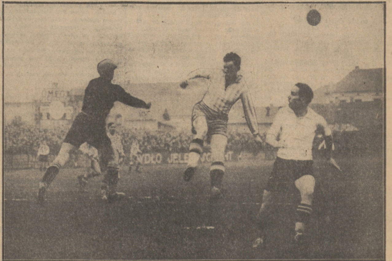
POD BRAMKĄ GARBARNI W KRAKOWIE

Portsmouth lokuje piłkę w bramce Huddersfield i wchodzi do finału.