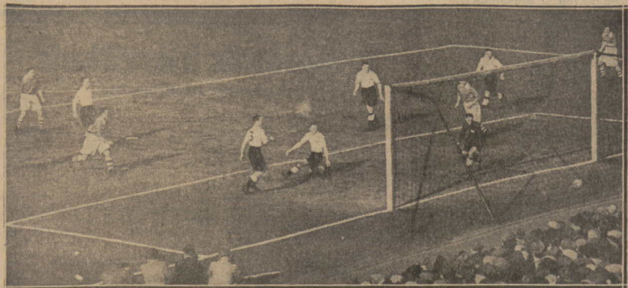
PÓŁFINAŁ PUCHARU ANGLII

Jabtonowski (Pomorze) w zwycięskiej walce z Goracznikiem.