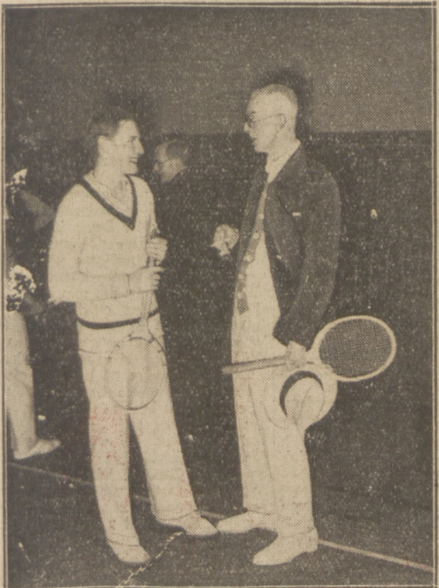
CRAMM i „MISTER G.”, to znaczy król szwedzki, który ostatnio grał w hali berlińskiej z mistrzem Rzeszy.

Sonja Henie sprawiła przedewszystkiem szalone wrażenie zjawieniem się w Wiedniu z szesnastoma kufkami i przywdzieniem do każdego ćwiczenia nowego stroju.