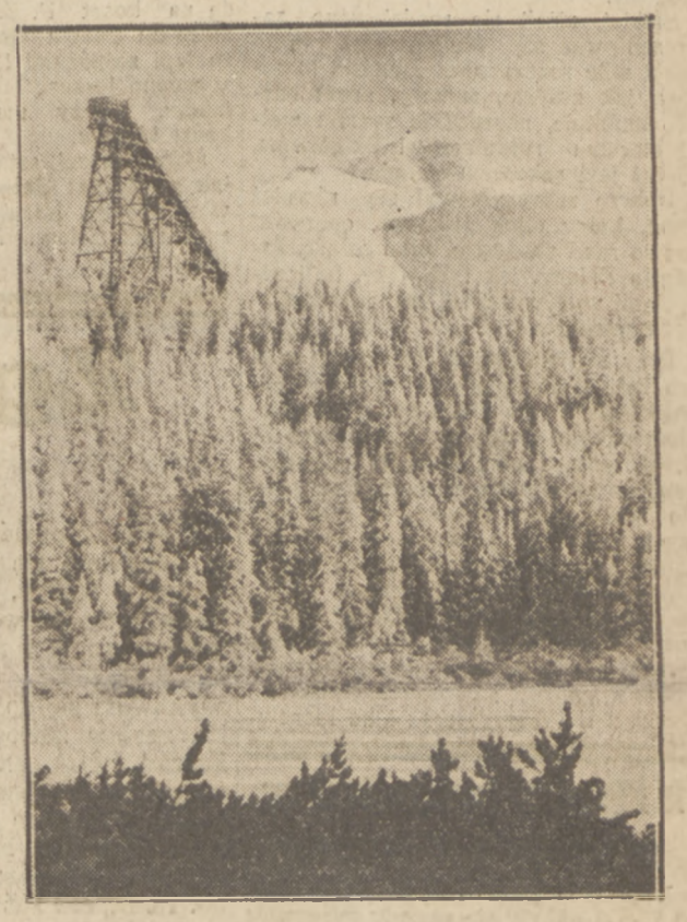
SKOCZNIA JAROLIMKA na której rozegrany zostanie mecz o mistrzostwo F. I. S.