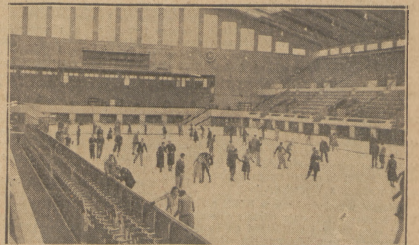
SZTUCZNY TOR W LONDYNIE, a właściwie w Wembley, jest naprawdę cudem techniki. Tam właśnie grają dwie słynne drużyny: Wembley Lions i Wembley Canadians finalistki hokejowego pucharu Europy.