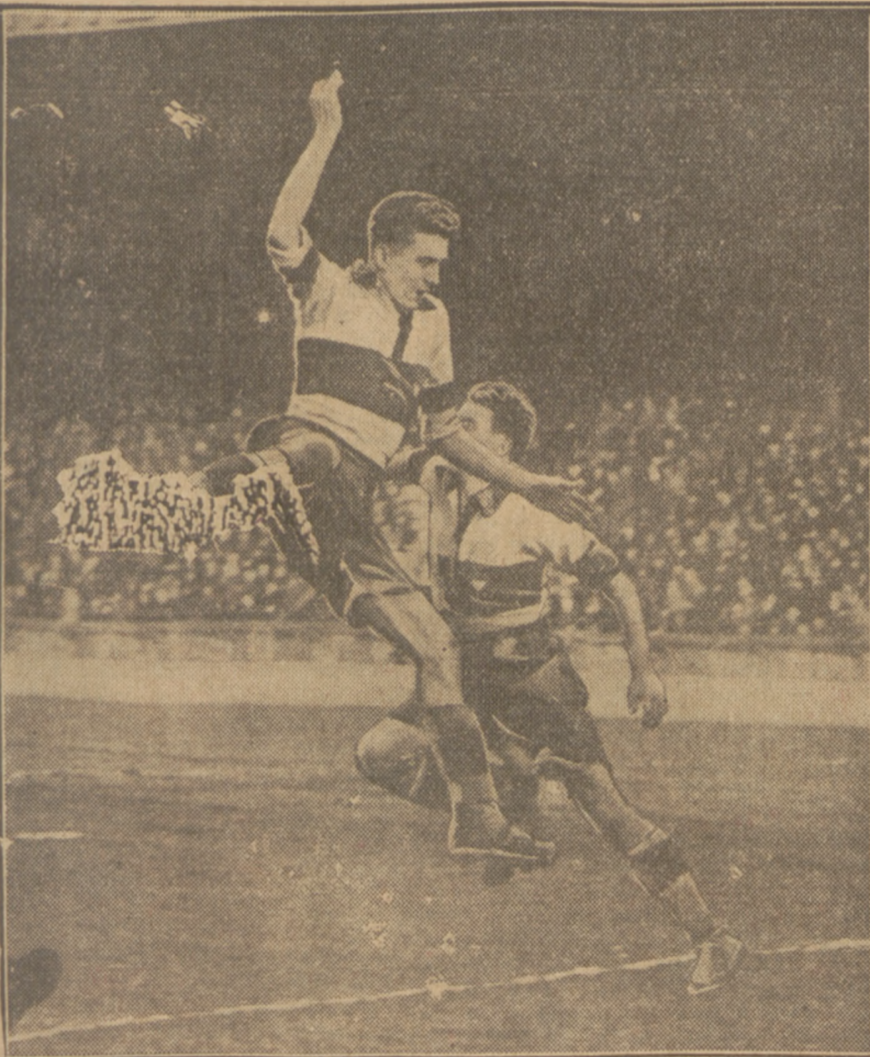
PARYŻ — PRAGA 1:0. Oryginalne zetknięcie dwu napastników francuskich.