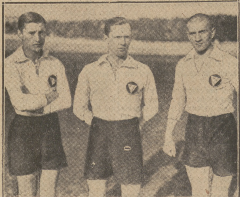
TRÓJKA POMOCNIKÓW GARBARNI

brała udział w turnieju na kortach Rochampton. Jak widzimy z ruchu, posiada ona dobre zadatki na mistrzynię, co najmniej rasy żółtej.