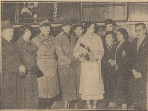
Walasiewiczówna na chwilę przed wyruszeniem do Ameryki, zęgnana przez grono przyjaciół z młn. Konopacką-Matuszewską i Januszem Kusocińskim na czelę