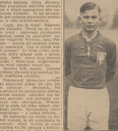
DYTKO (DAB) wyraża na reprezentacyjnego pomocnika pierwszorzędnej jakości