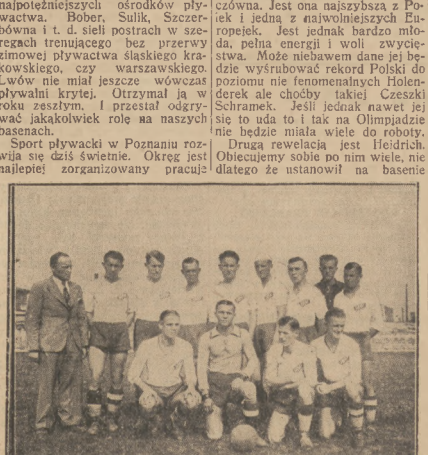
PIŁKARZE I. K. P. (ŁÓDŹ) rozwiązali swoją sekcję i gremialnie zasilił szereg Łódzkiej