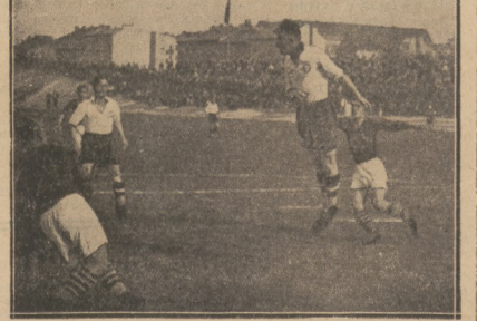
Z HISTORYCZNEGO MECZU Garbarnia — Polonia, po którym losy klubu stołecznego zostały przypieczętowane. (Garbarnia wygrała 6:0). Powyżej momentu pod bramką gospodarzy