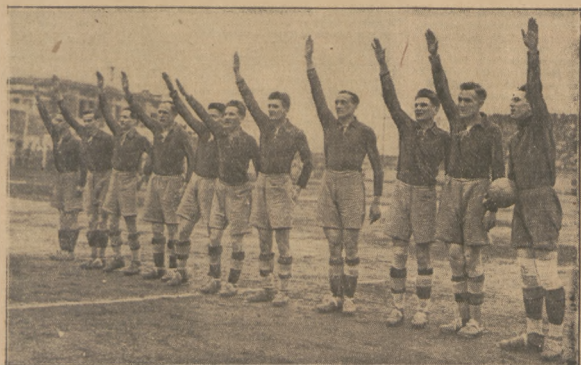
RISPENSIA (F. MESZWAR)

ledwiny zawodowy zespół piłkarski Rumunii, stanowiąc będzie trzon reprezentacji państwa przeciwko Polsce