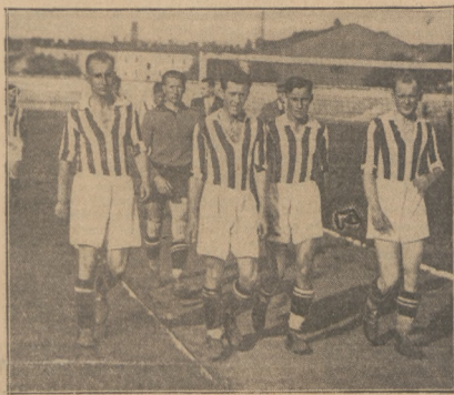
SMUTNE MINY mieli gracze Cracovii gdy schodzili z boiska po meczu z Legią.