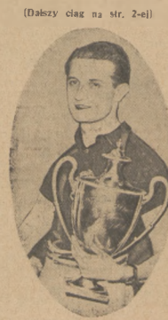
GYEZA BARNA pięciobrotny mistrz świata w ping-pongu bawił przez drugi w Polsce

znowu atakuje Szabo i prowadzi aż do ostatniej prostej.