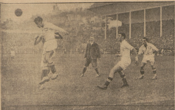
Z MECZU TEAMÓW B SZWAJCARIA — FRANCJA 3:2 W HAVRZE.

LONDYN—CZERWONE DJABŁY 2:1. BRUKSELLA. 1.11. — Tel. wł. — Do rano mecz piłkarski między niesofialną reprezentacją Belgii i amatorską reprezentacją Londynu wygrał Amelicy 2:1.