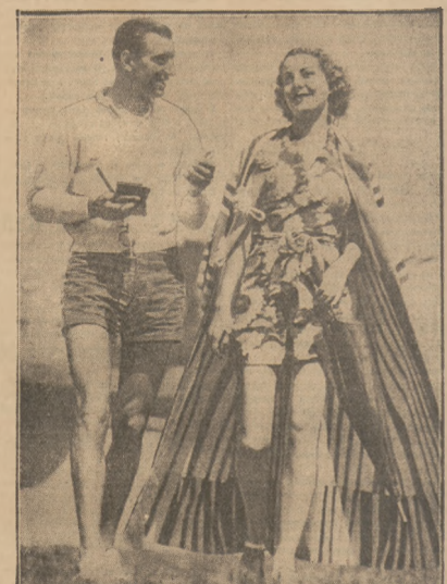
FRED PERRY I HELEN VINSON sa, jak wiadomo, małżeństwem, bardzo nowoczesnym. On „wpadł“ na chwilę do Hollywood, aby pogwarzyć z żoną na plaży, przed jej pracą w studio filmowym. Za kilka dni Perry jedzie do Australji.