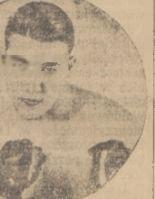
BOB OLIN zdejmowany przez Louisa II mistrza świata wagi półciężkiej