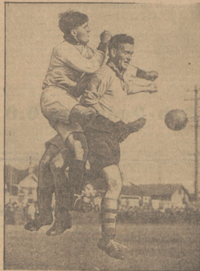
6 NÓG A TYLKO DWIE GŁOWY. Nie jest to słynny potwór z Loch Ness, ale moment z zażartego meczu piłkarskiego.

— „Gazeta Sporturilor” w 1935 r. z dnia 12 października Polski dyskredytowała formułkę całkowitego odmłodzenia składu (?) i wyowiadała się za stopniowe odmłodzanie, które jedynie może dać wyniki dodatno.