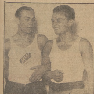
Z MECZU BOKSERSKIEGO I. K. P. — SOKOŁ 10:6 w ŁODZI TABOREK — MISIUREWICZ