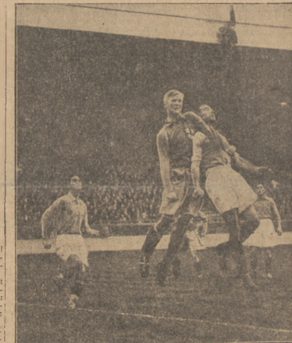
FRANCJA — SZWECJA 2:0 Moment z meczu w Paryżu