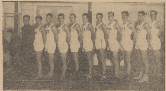
ZESPÓŁ GIER Y. M. C. A. ŁOTEWSKIEJ który rozegra szereg spotkań w Warszawie i Krakowie.