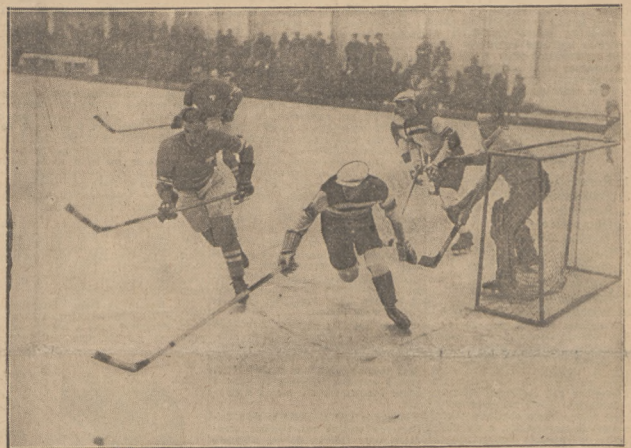
KRYTYCZNA SYTUACJA POD BRAMKĄ LWOWIAN. Od lewej: Ticu (Rum.), Lemiszko, Stanicki, Sztencel.

Na Głowackim znał było początkowo brak zaprawy, uzyskał on jednak pod koniec obozu szybkość i strzał.