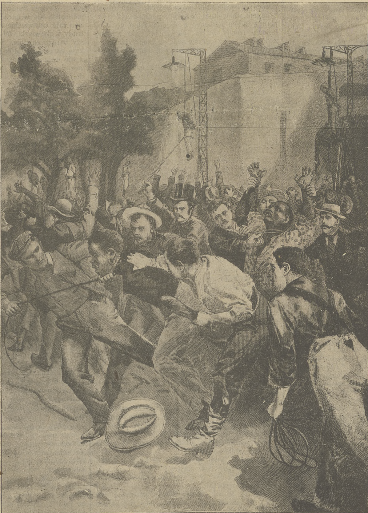
Ludność miasta Toroute w Kanadzie wiesza bez sądu murzynów podejrzanych o zamordowanie białej kobiety.