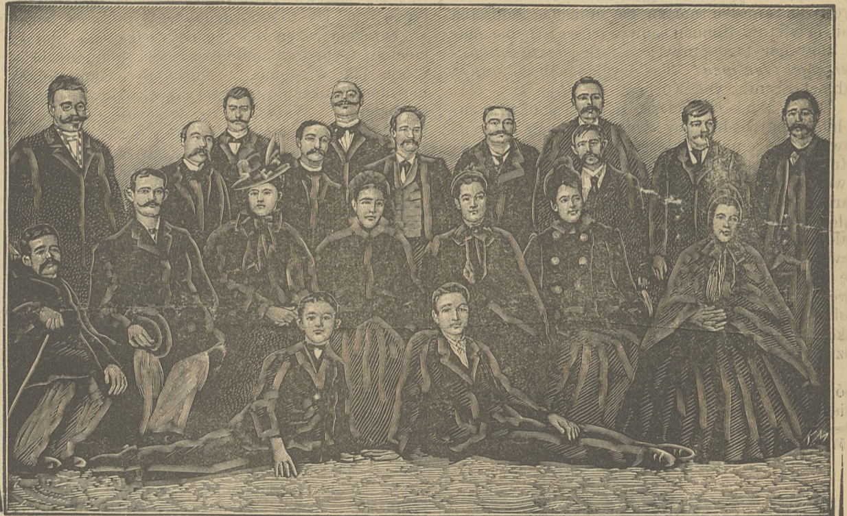
Matki, ojcowie i dzieci polskie, skazane w procesie wrzesińskim.

ale nie można na razie połapać się w sprzecznych wersjach.